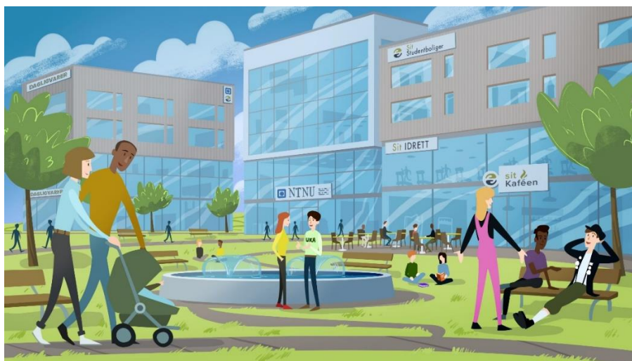
Figur 1: Illustrasjon av fremtidens campus, Headspin AS

En aktiv campus vil skapes ved å legge til rette for organisert og uorganisert fysisk aktivitet samtidig som kulturell og ideell frivillighet gis rom til å blomstre. En urban campus vil skapes gjennom attraktive serveringssteder, et mangfold av tjenester og trygge, sentrale studentboligstrøk. En inkluderende campus skaper sosiale møteplasser, tilrettelegger for læring og forebygger ensomhet, samt gi et tilbud til byens øvrige befolkning og studentforeldre.