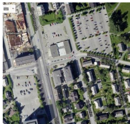
Holtermannsveien 1 og Hestehagen