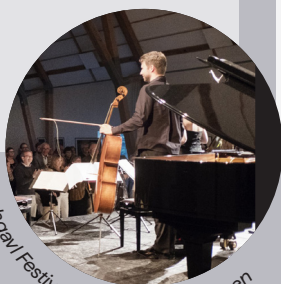
Hilsøgaard Festival. Foto: Mathias Bojesen

Festivalerne strækker sig over genrer som klassisk musik, jazz, folkemusik, opera og ny musik.