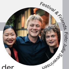
Festival & Friends.