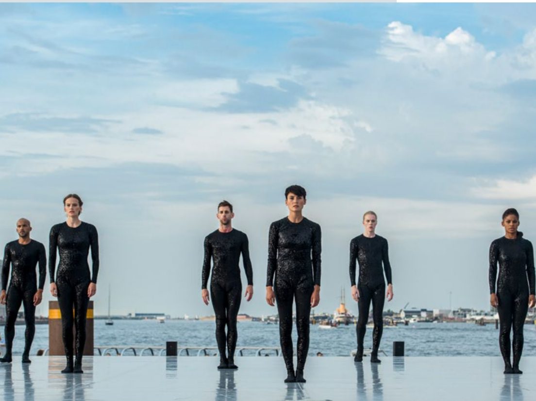
Copenhagen Summer Dance v/ Dansk Danseteater