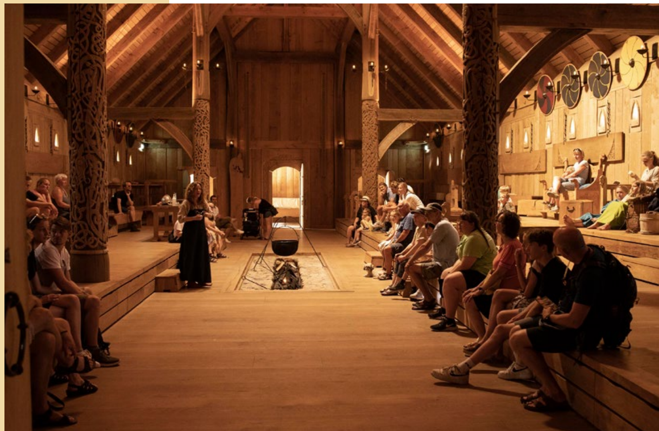
Kongehallen, Sagnlandet Lejre