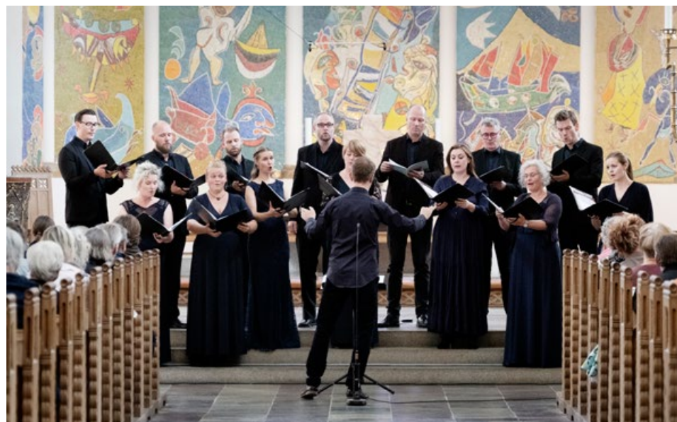
Rued Langgaard Festival, Ribe