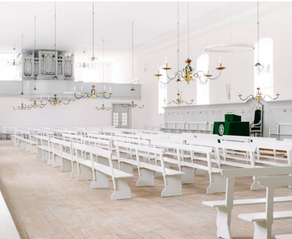
Brødremenighedens Kirke, Christiansfeld