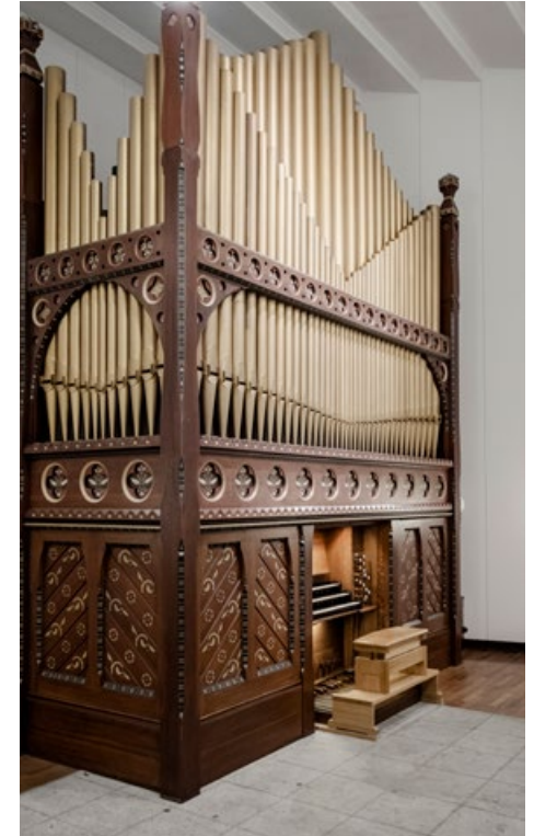
Det Kongelige Danske Musikkonservatorium