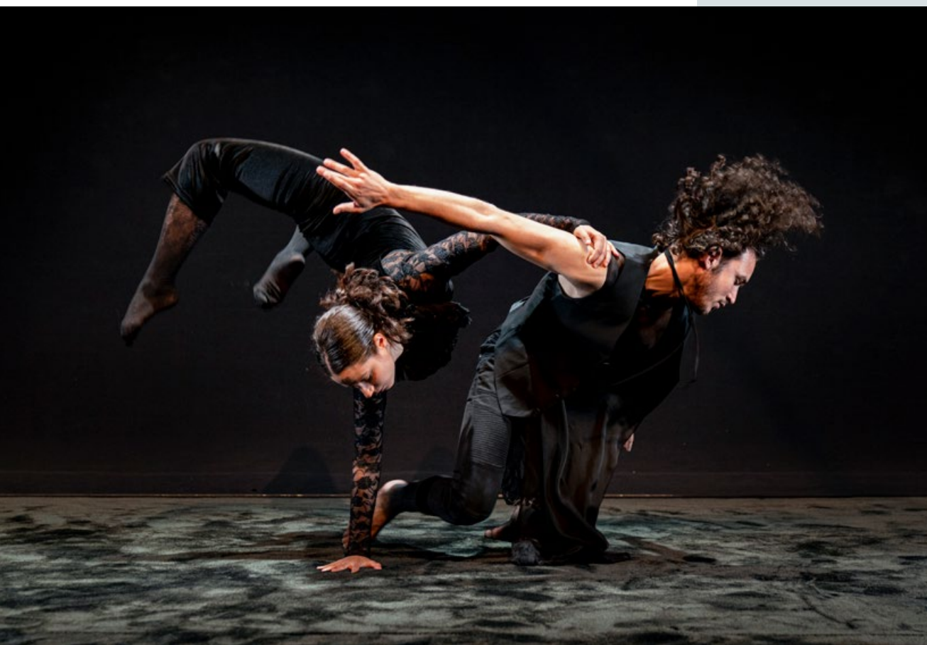
Black Box Dance Company

Fonden støtter scenekunst af høj kvalitet, der bidrager til refleksion og oplevelse gennem eksistentielle fortællinger og æstetiske udtryk. Støtten ydes primært til professionelle aktiviteter inden for dans og musikdramatik.