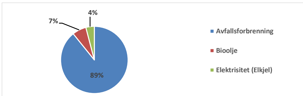
Figur 1 Energimiks produsert fjernvarme fra Eviny i Bergen 2022.