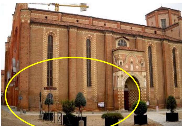
Prima dell'installazione nel 2018