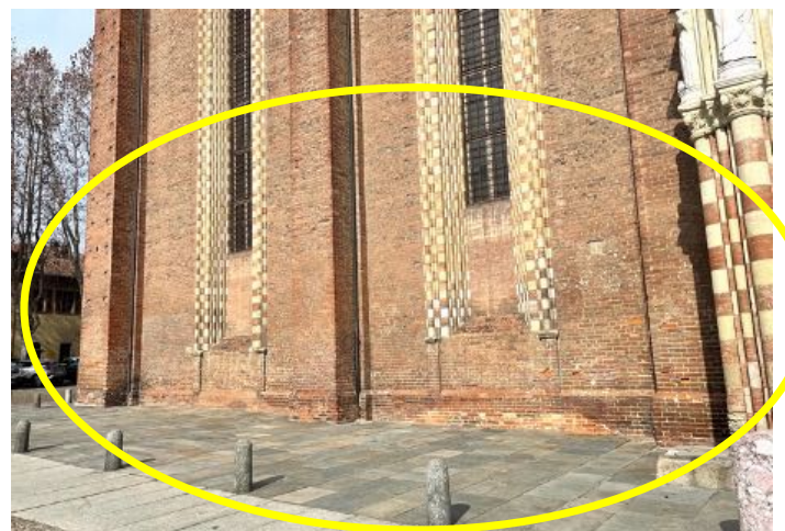
a marzo 2023