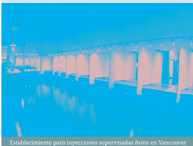
Establecimiento para inyecciones supervisadas Insite en Vancouver

Existe actualmente un conflicto interno insostenible de las políticas – en medio del cual han quedado atrapados los profesionales de la salud. En todo el mundo, los enfoques para la reducción de daños centrados en evidencias vienen evolucionando y ganando terreno, (11) pero operan al interior de un marco cargado políticamente de la guerra contra las drogas que maximiza los daños.