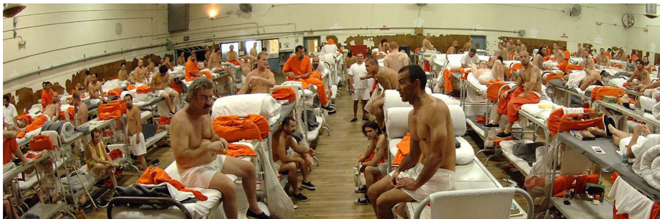
Las políticas de drogas actuales han llevado al escalamiento de las poblaciones penitenciarias

Oficina de las Naciones Unidas sobre Drogas y el Delito 2012