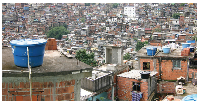
Los países donde se producen y por donde transitan las drogas están liderando el debate sobre alternativas a la guerra contra las drogas

Ésta es una simplificación y un resumen “ de foto instantánea ” sobre el continuum actual de modelos de políticas que se encuentran en el mundo real, algunos de los cuales involucran interacciones más complejas de salud y fiscalización en distintas etapas de su evolución. (Para conocer más sobre estas alternativas, consultar el portal www.countthecosts.org ).