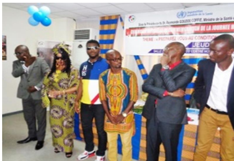
Les artistes musiciens et humoristes au côté du Ministère dans la lutte contre le tabagisme