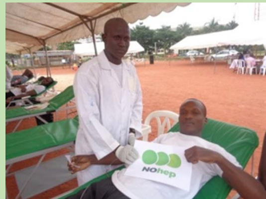
6 août 2016, Place SOCOCE

L'UNICO, le PNLHV et le PLNS forment 7 entreprises pour le dépistage et la prise en charge des employés et 7 ONG dans le dépistage et la prise en charge des populations clé ( financé par ROCHE).