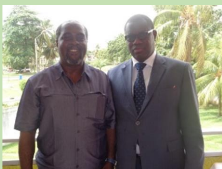
Ici une photo avec le Président du groupe thématique du CCM.