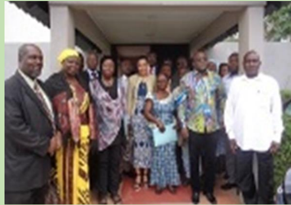
5 août 2016, Pavillon Latrille Cocody

Discours du Représentant du Ministère de la Santé et de l'Hygiène publique.