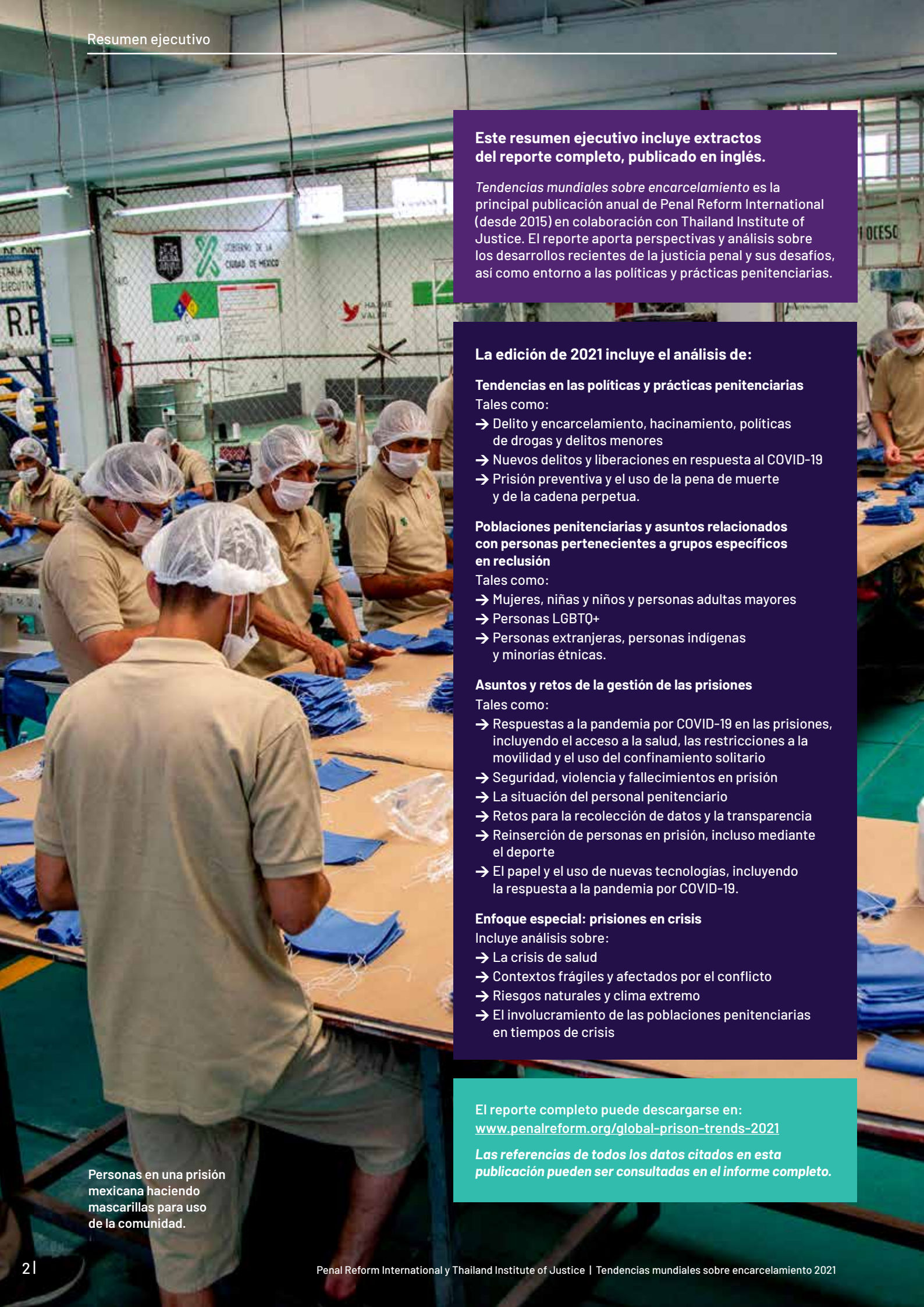
Personas en una prisión mexicana haciendo mascarillas para uso de la comunidad.