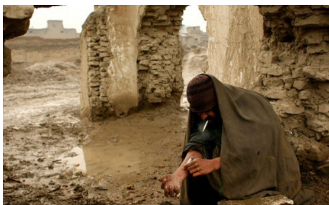
Las personas que viven en la pobreza son más susceptibles a los daños potenciales del consumo de drogas

Los efectos discriminatorios de las políticas sobre drogas pueden ser identificados a través de un rango de indicadores, como las tasas de encarcelamiento y arrestos para las poblaciones afectadas. En contraste, el estigma es más difícil de medir, aunque el monitoreo de los medios de comunicación, las encuestas de opinión pública, y la investigación cualitativa respecto a las percepciones y experiencia de los consumidores de drogas, pueden revelar su prevalencia.