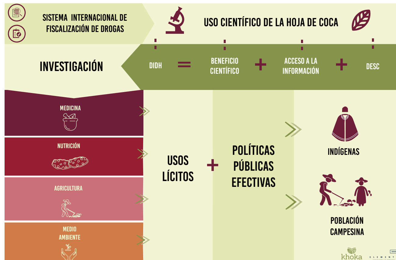
Figura 1: Infografía Dialogo sobre usos de la hoja de coca