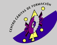
Centro Cárteras de Formación para la Atención de Farmacodependencias y Situaciones Críticas Asociadas (CAFAC) - México