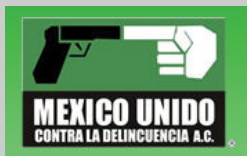
México Unido Contra la Delincuencia (MUCD)