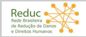
Rede Brasileira de Redução de Danos e Direitos Humanos