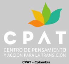
CPAT - Colombia