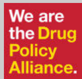
Drug Policy Alliance - Estados Unidos