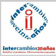
Intercambios - Argentina