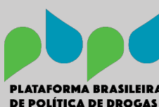
Plataforma Brasileira de Política de Drogas