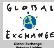
Global Exchange - Estados Unidos