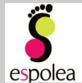
Espolea - México