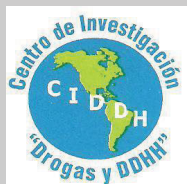
Centro de Investigación Drogas y Derecho (CIDDH) - Perú