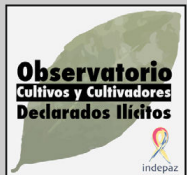
Observatorio de cultivo y cultivadores declarados ilícitos, INDEPAZ-Colombia

Desde la Asociación Costarricense para el Estudio e Intervención en Drogas (ACEID) y con el apoyo de las organizaciones abajo firmantes, hacemos un llamado al Poder Judicial, instituciones estatales, a las organizaciones defensoras de derechos humanos y a la sociedad civil para que se pronuncien en contra de la criminalización y el encarcelamiento de personas que usan drogas en Costa Rica y contra el manejo desproporcionado y desmedido por parte de las autoridades en el caso del señor Cerdas. Las discusiones ya sobrepasan las posiciones personales o juicios morales sobre el consumo de cannabis, esto es un tema serio de respeto a los derechos humanos en Costa Rica y la defensa de nuestra institucionalidad democrática.