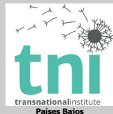
transnationalinstitute - Países Bajos