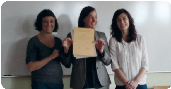
Une lauréate heureuse lors de la première remise de diplômes DAS

de l'être (prévention, réduction des risques, traitement, répression). L'exigence de la qualité des enseignements, éprouvés et à la pointe des recherches en la matière, est primordiale: un équilibre est recherché entre théories, recherches et pratiques. Pour réussir cette alchimie complexe et en perpétuelle évolution, la fordd peut compter sur le réseau romand des addictions. Les principaux centres de formation universitaires médicaux, infirmiers, sociaux, sont acteurs, protagonistes de cette formation. Les ajustements des contenus, des thèmes ont été réalisés en 2016 par une commission pédagogique qui s'est réunie à six reprises.