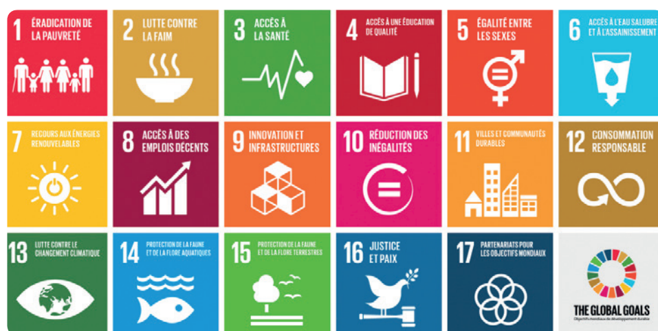
Les Objectifs de développement durable répondront à l'avenir aux défis des politiques drogues en lien avec les droits humains (source : UNODC)

Par ailleurs, au-delà des principes, des actions concrètes ont aussi été menées dans le but de développer la réflexion et nourrir le débat national et international sur l'approche des droits humains et de la santé dans le domaine des addictions et des substances psychoactives. Longtemps cloisonné, le débat sur les drogues s'est finalement ouvert vers les droits humains et la santé. Les nouvelles dynamiques que ce changement de paradigme peut offrir représentent par ailleurs la meilleure opportunité pour tous de défendre un équilibre tant nécessaire comme souhaitable pour proposer des solutions aux problématiques de dépendances respectueuses des droits humains, durables et efficaces.