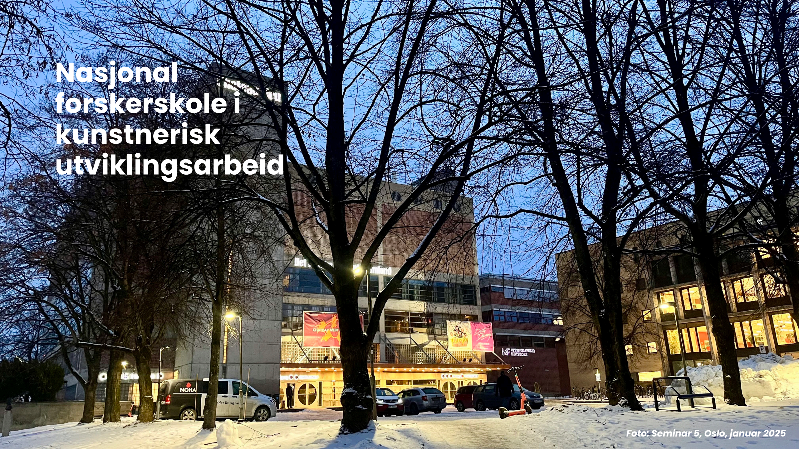
Foto: Seminar 5, Oslo, januar 2025