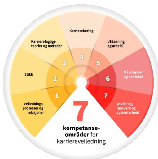
Illustrasjon 1: Modellen gir en oversikt over de sju kompetanseområdene i de tverrsektorielle kompetansestandardene.

Kompetansestandarder for karriereveiledning er én av fire deler i Nasjonalt kvalitetsrammeverk for karriereveiledning. 8 Disse kompetansestandardene er tverrsektorielle og gir en oversikt over hvilken kompetanse de som jobber med karriereveiledning, bør ha. Kompetansestandardene angir syv kompetanseområder, som til sammen gir en detaljert beskrivelse av hva en karriereveileder bør ha av kompetanse. Hvert kompetanseområde har en innledning med en kort, overordnet beskrivelse av området. Deretter følger en detaljert beskrivelse av innholdet i kompetanseområdet, som er selve kjernen i en karriereveileders kompetanse.