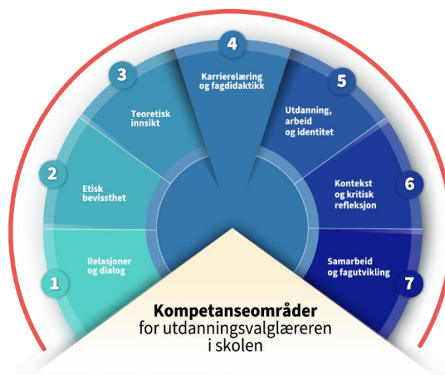
Illustrasjon 3: Modellen gir en oversikt over de sju kompetanseområdene i kompetansestandardene for utdanningsvalglæreren.

Kompetansestandardene for utdanningsvalglæreren er bygd opp på samme måte som de tverrsektorielle standardene og består av sju kompetanseområder. Til hvert område er det laget egne titler, introtekster, delkompetanser og kommentarer til disse. Delkompetansene består av kunnskaper og ferdigheter. Omfanget og innholdet i kompetansestandardene er karrierefaglig begrunnet i den rollen utdanningsvalglæreren har i tilretteleggingen av karrierelæring for elevene. Det har dessuten vært et mål å gjøre beskrivelsen av kompetansene så kortfattet og presis som mulig, og gi dem en språklig form som kommuniserer godt til lærerne selv og skolelederne. Karrierelæring og fagdidaktikk står i en særstilling blant de sju områdene, fordi det er kjernen i utdanningsvalglærerens praksis.