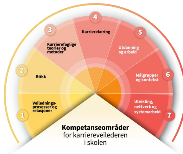
Illustrasjon 2: Modellen gir en oversikt over de sju kompetanseområdene i kompetansestandardene for karriereveilederen i skolen.

karriereveileder i skolen ikke skal skille seg mye fra de tverrsektorielle kompetansestandardene, siden faget er det samme uavhengig av sektor eller målgruppe.