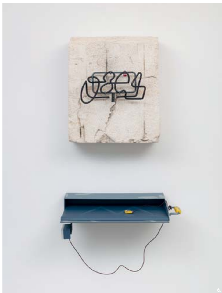
6 — Empty Every Night (08:04 LG) , fibre de verre, résine polyester, pigments, tige en acier enduit de poudre et aluminium, résine imprimée UV pulvérisée, contreplaqué pulvérisé, cordon en cuir; 2 pièces, 134 x 65 x 36 cm, 2019 /fibreglass, polyester resin, pigments, powder coated steel rod and aluminum, sprayed UV printed resin, sprayed plywood, leather cord; 2 parts, 134 x 65 x 36 cm, 2019

3D modelling, 3D printing, wood carving, casting and metalwork. What appears to be a bricolage of redundant everyday gubbins, has been fabricated with boxfresh sleekness.