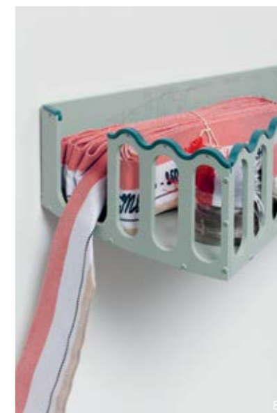
7 & 8 — Sentinel (Watermelon) , fibre de verre et résine de polyester pulvérisées, aluminium brossé à l'air, viscose tissée sur mesure brodée, polyester et coton, fonte d'aluminium, cuir gravé au laser, ficelle de coton, aluminium enduit de poudre, 142 x 159 x 35 cm, 2018 /splayed fibreglass and polyester resin, air brushed aluminium, embroidered custom weave viscose, polyester and cotton, sand cast aluminium, laser engraved leather, cotton twine, powder coated aluminium, 142 x 159 x 35 cm, 2018

au début du XX e siècle, des «contre-reliefs» de Vladimir Tatlin aux œuvres actuelles d'Iza Genzken. Mais ce sentiment de malaise provient également du fait que leurs éléments constitutifs ne correspondent pas à ce qu'ils semblent être à première vue: il s'agit de simulacres issus de la modélisation 3D, de l'impression 3D, de la sculpture du bois, du moulage ou de la métallurgie. Ce qui pourrait passer pour un bricolage de rebuts du quotidien est en réalité le fruit d'une soigneuse fabrication contemporaine.