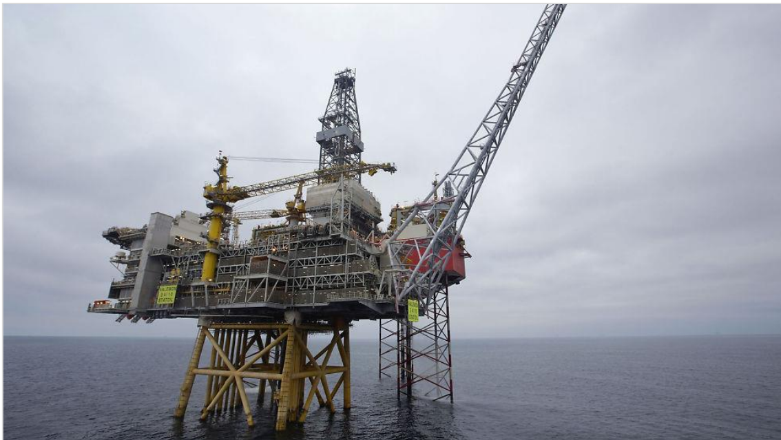
Figur 2.2: Bilde av Valemon-plattformen ute på feltet.

Et bilde av Valemon-plattformen ute på feltet er vist i figur 2.2.