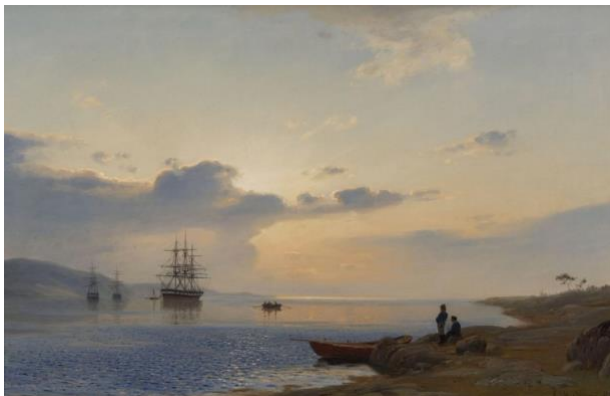
Amaldus Nielsen, Landskap

Å bygge vår egen samling som består av både billedkunst og kunsthåndverk har vært en sentral oppgave, som har ført til at museet har ervervet kunst av både regionale og nasjonale kunsthåndverkere og billedkunstnere.