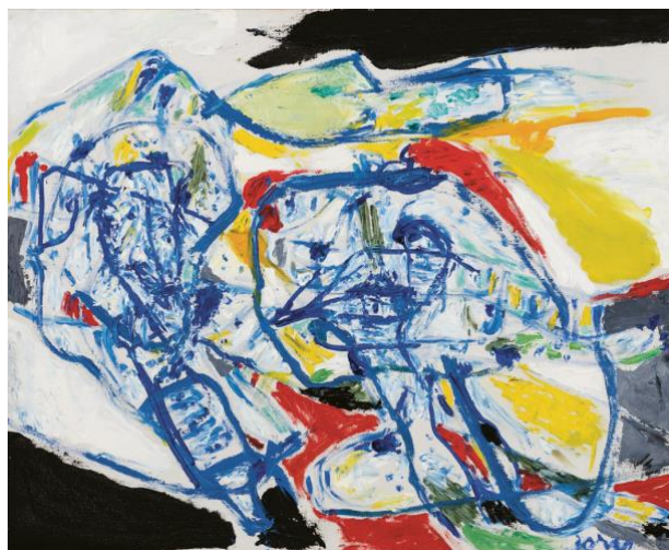
Asger Jorn, L'abominable homme de neigesm 1959

Museet har foretatt betydelige innkjøp av kunst til Sørlandets Kunstmuseums samling. Dette er utført med midler fra ekstraordinære Covid-bevilgninger over nasjonalbudsjettet. Innkjøpene har styrket den regionale delen av samlingen. I tillegg er det fortatt innkjøp av kunsthåndverk ved hjelp av egne midler og tilskudd fra AKO.