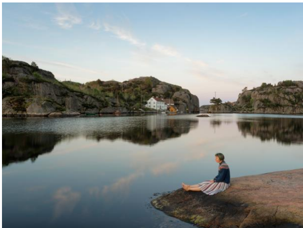
Elina Brotherus, Morgen i Ny-Hellesund, 2018

De viktigste oppgavene knyttet til mottaket er utpakking, tilstandsvurdering, registrering, fotografering, plassering og eventuelt konservering/repasjon av verkene. Mottaket vil involvere flere av museets kompetanseområder, som registrarer, konservatorer, fotografer og museumsteknikere.