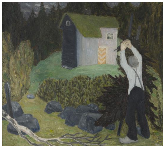
Harald Kihle, Lauvstakken

Vi er klare for mottak av Tangen-samlingen, dvs at magasin/lager og nødvendig personell er på plass. Mottaket av Tangen-samlingen, 4.500 verk, starter i begynnelsen av 2023.