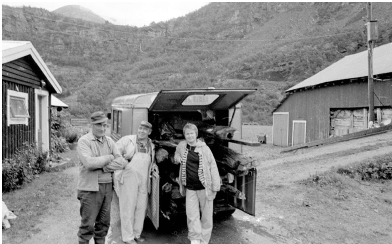
Løa ble demontert og fraktet i en kassebil til Paris. Dokumentasjonsfoto Gjerdeløa, 1980. Kunstsilo

På veggene inne i løa var det inskripsjoner fra folk