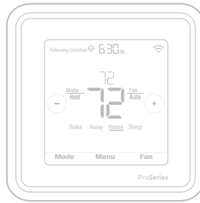
*TH6320ZW2003 depicted. Actual size 4.09" x 4.09" x 1.06"