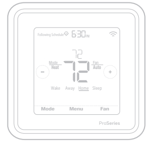
*TH6320ZW2003 montré. Dimensions réelles 4,09x4,09x1,06 po

Veillez lire le mode d'emploi et le conserver en lieu sûr