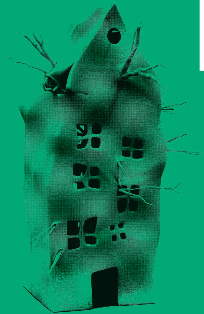
Psychoarchitecture, photo: Blaise Adillon, 2010 © BerdaguerPejus/ADAGP

Une exposition créée par le Pavillon de l'Arsenal, réimaginée pour le Pavillon Sicli