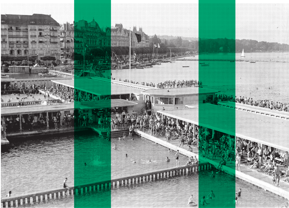
Bains des Pâquis, Genève Frank-Henri Jullien, 1932 © Bibliothèque de Genève