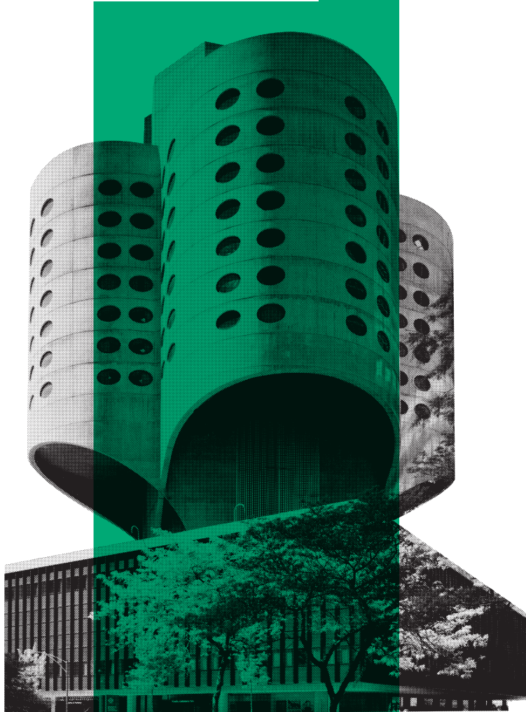
Vue extérieure du Prentice Women's Hospital, Chicago Bertrand Goldberg architecte