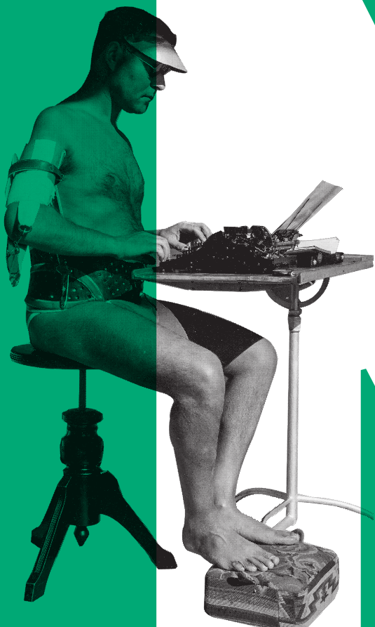
Cure de travail dans un sanatorium de Leysin, vers 1930