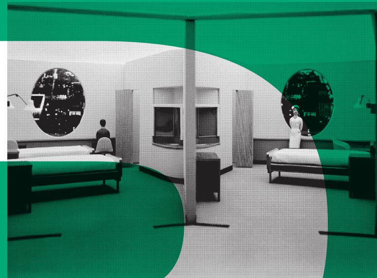
Maquette du Prentice Women's Hospital and Maternity Center, Chicago Bertrand Goldberg architecte, photo: Hedrich-Blessing, 1975 © Chicago History Museum, Hedrich-Blessing Collection