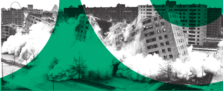
Destruction d'un immeuble de l'ensemble de Pruitt-Igoe, 22 avril 1972