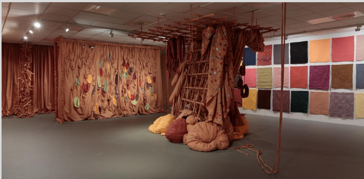
Fra John K. Rausteins utstilling "Glemselens arkiv".

Utstillingen besto av en flerkanals videoinstallasjon, med et 34 minutter langt abstrakt videoverk projisert på hvite silkeduker, akkompagnert av en lydkomposisjon av Andreas Nelson og Gyrid Nordal Kaldestad. Opplevelsen i rommet ble preget av de ustabile silkestoffenes blafring, som oppsto av publikums bevegelser. I møtet mellom det menneskelige, det digitale og det taktile som oppsto i utstillingen ble vi del av en situasjon der våre handlinger påvirket omgivelsene.