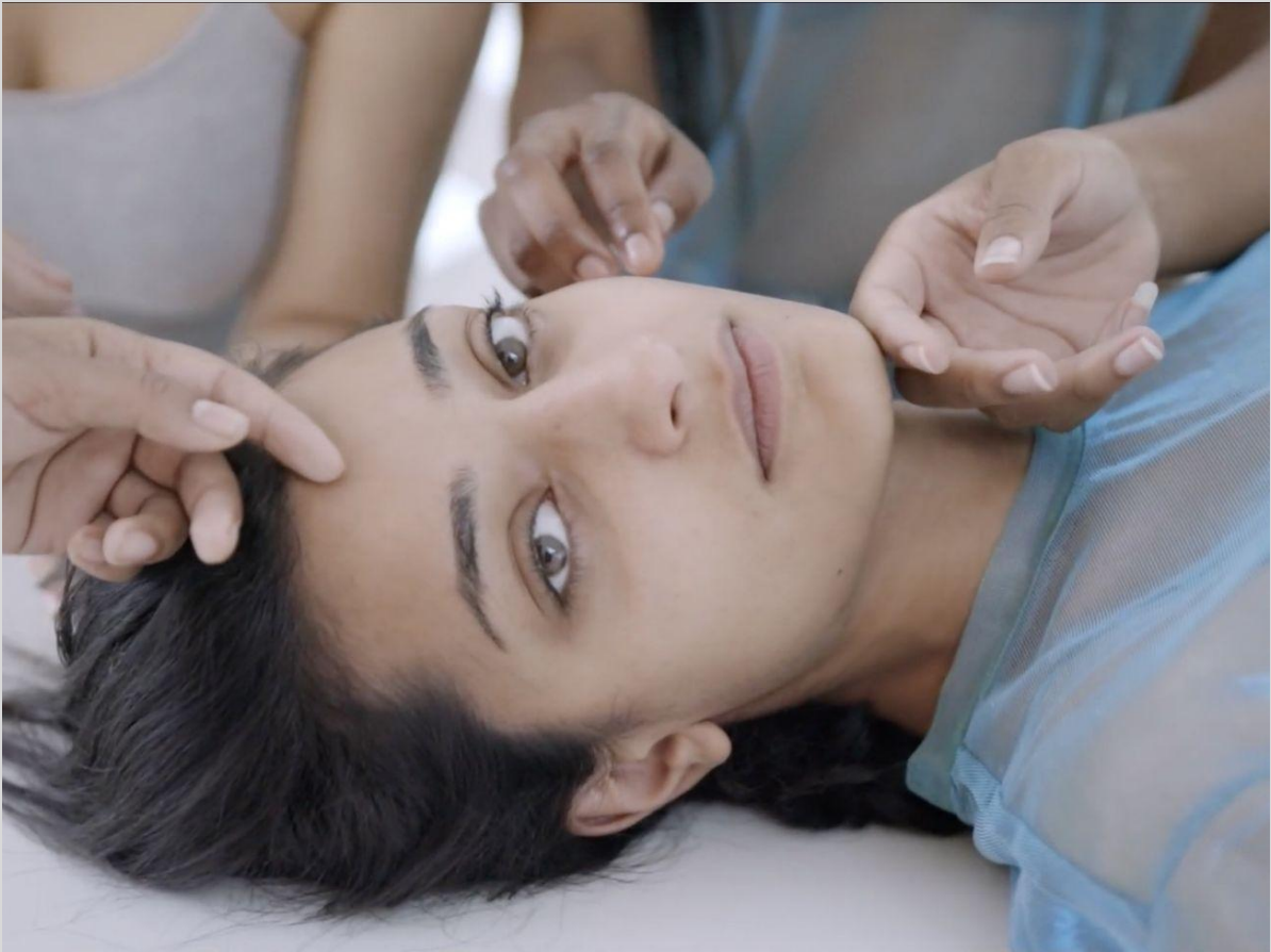
Stillbilde fra filmen TRANSITION III av Synnøve Sizou G. Wetten.