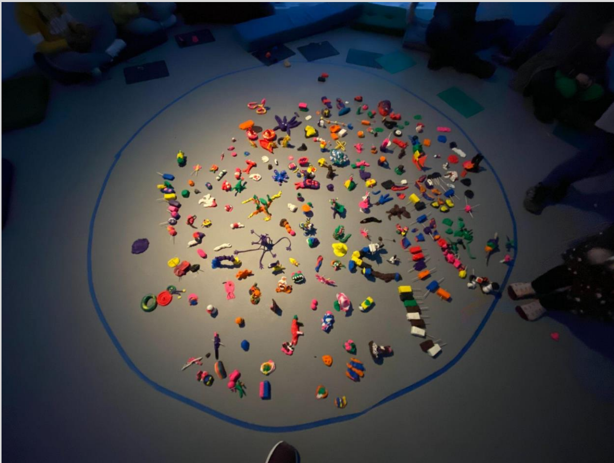
Fra familieverksted med Øistein Waage Johansen.