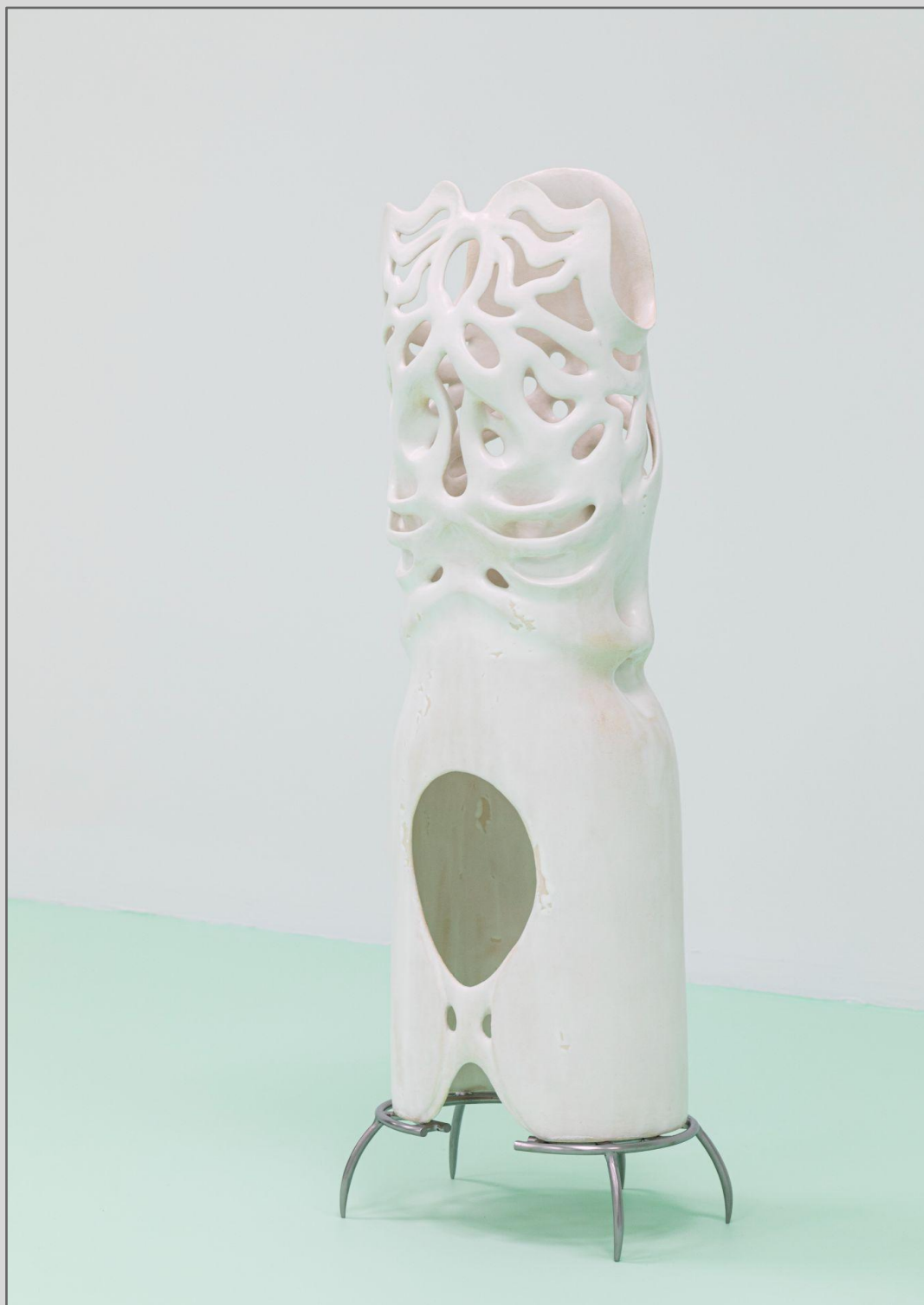
Linda Morell: Amygdala, glasert steingods og stål, 2021.

Fra utstillinger i galleriet kjøpte Stiftinga Museet i Sogn og Fjordane inn to skulpturer fra utstillingen "Balsamarium" av Linda Morell.