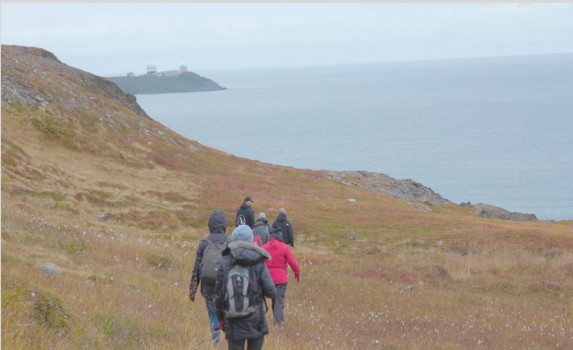
Kunstnerne fra Transmissions residency og utvekslingsprogram for lydkunst på guidet vandring til Ultima Thule, en grotte under fjellet Domen, Vardø 2021. Foto: Sanjey Sureshkumar (stillbilde fra film om prosjektet).

Dokumentarfilmskaper Sanjey Sureshkumar var med på begge reisene og gjorde opptak av kunstneres research del av en serie korte filmer som skal formidle Vardø-prosjektene.