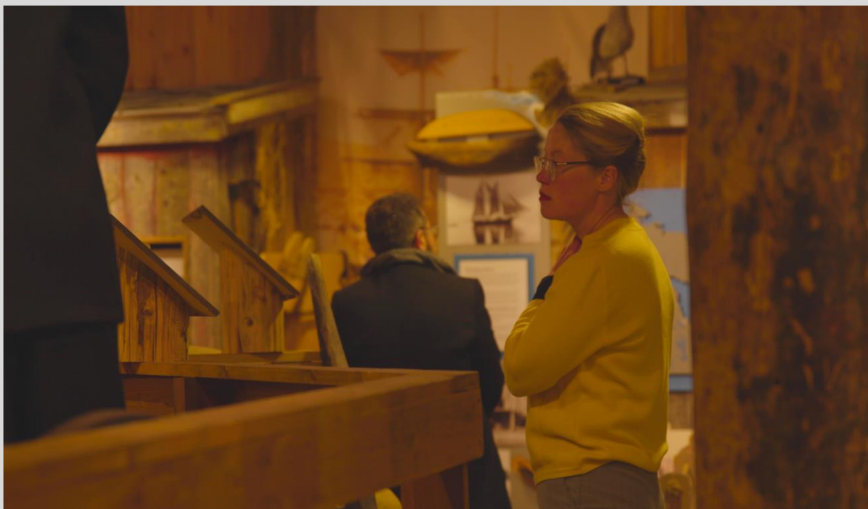
Alt Går Bra besøker Varangermuseet, 2021.