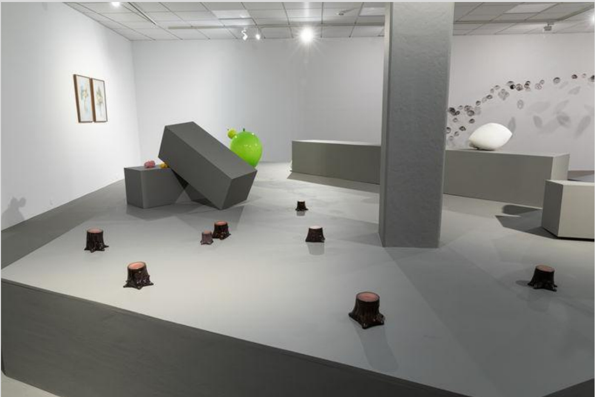
Oversiktsbilde fra utstillinger Glasstilstander . I forgrunnen: Tillie Burden: Forest .