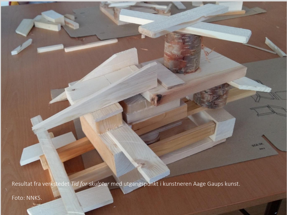
Resultat fra verkstedet Tid for skulptur med utgangspunkt i kunstneren Aage Gaups kunst.