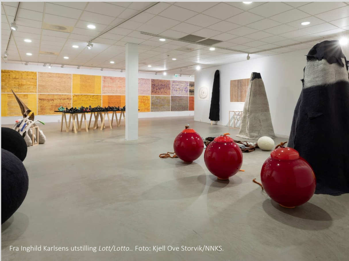
Fra Inghild Karlsens utstilling Lott/Lotto..