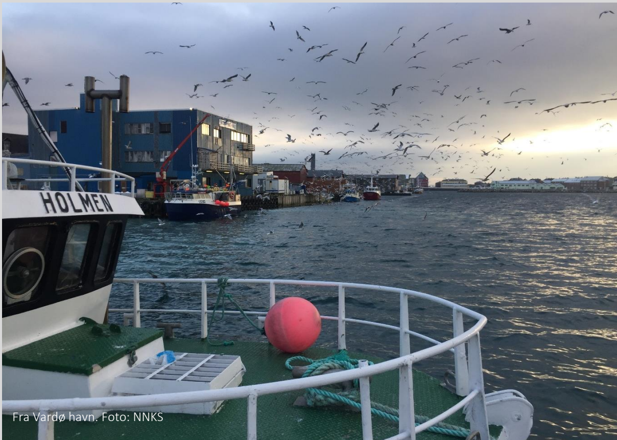
Fra Vardø havn.