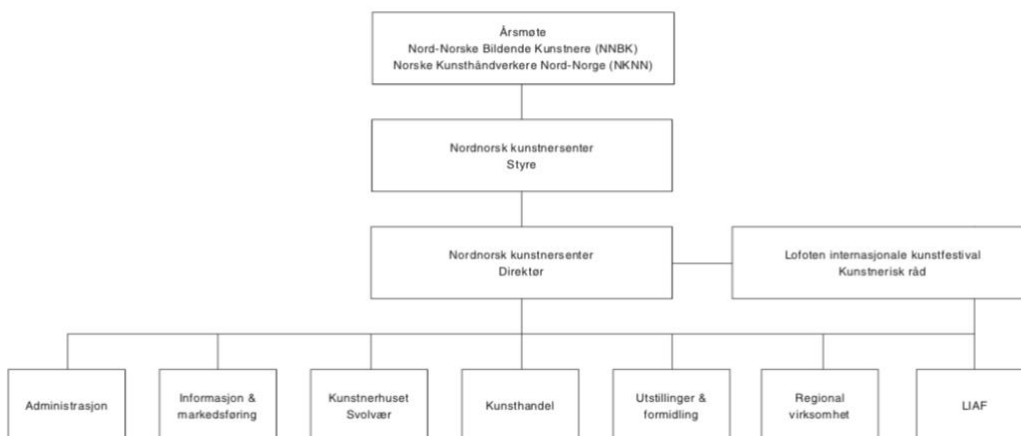
Organisasjonskart over Nordnorsk kunstnersenter

I kartet under er samarbeids- og organiseringslinjen fjernet uten et årsmøtevedtak.