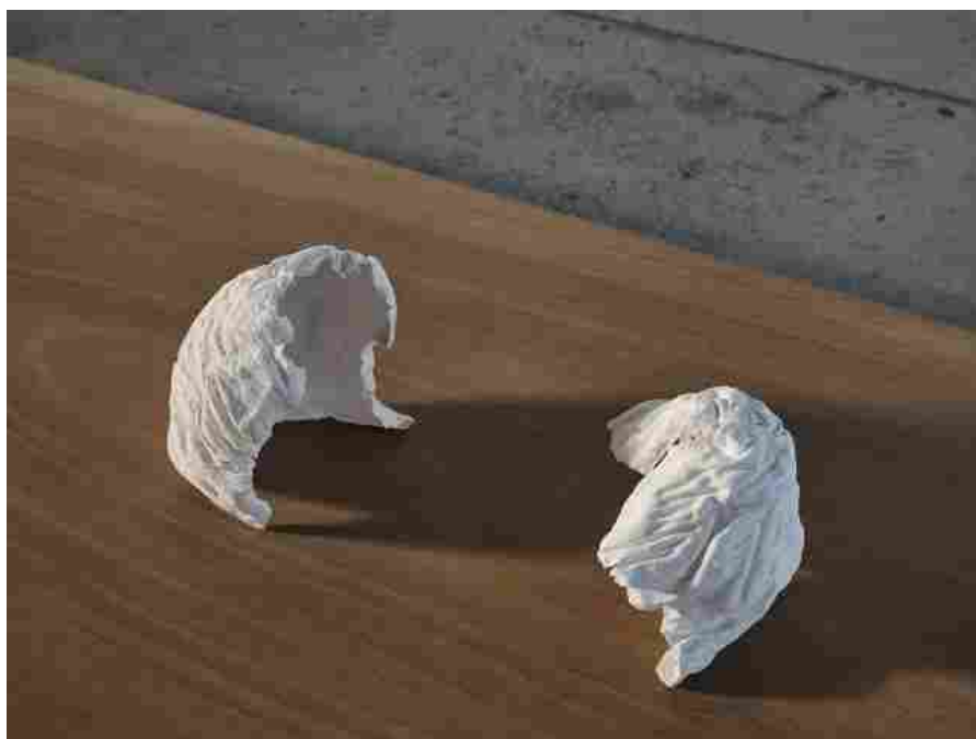
FANTA_RASO, Margherita Raso, Lottatori, 2015 (dettaglio / detail) Porcellana, legno / porcelain, wood (87 × 50 × 17 cm) Courtesy of the artist and Fanta-MLN, Milano Photo: Beppe Raso

Ma quali sono gli espositori che riescono a sostenere meglio l’urto di questo cambiamento digitale? Nelle nuove fiere digitali è difficile che ci sia quell’attività di “ matching ” (di incontro diciamo), come avviene nella fiera tradizionale. Una fiera in presenza, favorisce quell’attività di “ scouting ” e scoperta di artisti emergenti, che, per motivi logistici è molto più ardua nelle fiere digitali.