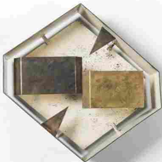
NILUFAR_PONTI, Lampada da parete mod. 12661 di Gio Ponti Italia, 1957, Produzione Arredoluce, Ottone, metallo (31.5 x 37 x 11 cm)

Il gap digitale con gli altri Paesi, da sempre stigmatizzato dal mondo del contemporaneo, è rimasto per anni un appello inascoltato, ha fatto capire che il futuro non sarà la fruizione virtuale dell'arte, bensì sarà necessario potenziare la comunicazione e il marketing digitale per l'accesso ai servizi, la partecipazione agli eventi e per l'introduzione dei nuovi linguaggi del contemporaneo, e perché no, per fare acquisti direttamente da casa.