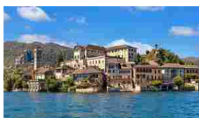
20 magici borghi italiani all'insegna dell'arte