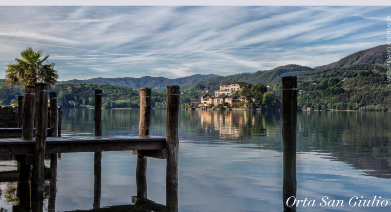
PIRELLA GÖTTSCHE LOWE