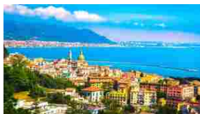
Vietri sul Mare, gioiello straordinario della Costiera Amalfitana