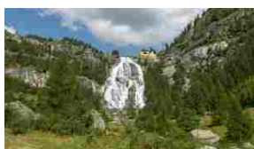
Cascata del Toce, spettacolo incredibile delle Alpi