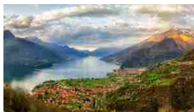
Lago di Como: per il "Telegraph" è l'anno ideale per visitarlo