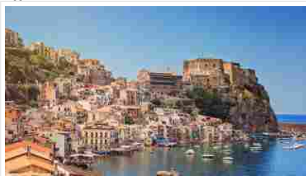
I borghi italiani da raggiungere in treno