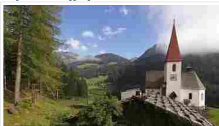
Da Nord a Sud, viaggio nell'Italia segreta

L'articolo Una Boccata d'Arte : i borghi italiani si trasformano in un museo diffuso. Da visitare nel weekend sembra