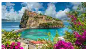
Il Castello Aragonese, gioiello di Ischia circondato dalle acque