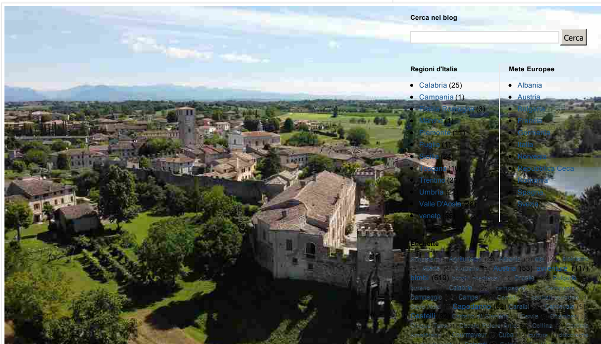
Castellaro Lagusello, nel mantovano, è protagonista del progetto Una Boccata d'arte

Indica il tuo indirizzo email per iscriverti. Es. abc@xyz.com