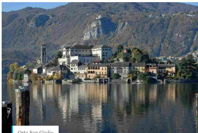
Orta San Giulio

Orta San Giulio, in provincia di Novara, è uno dei borghi più belli d’Italia e vanta anche la Bandiera Arancione del Touring Club Italiano. È un luogo che sembra essersi fermato nel tempo, ma con un patrimonio artistico e culturale di notevole pregio. La località si trova sulle sponde del lago d’Orta, famoso per il legame speciale con Gianni Rodari, del quale il 23 ottobre 2020 si celebra il centenario dalla nascita. Da Orta San Giuliano, attraverso un ponticciolo, si raggiunge l’isola di San Giulio, dove lo scrittore ha ambientato il romanzo “C’era due volte il barone Lamberto”.