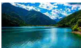
Il Lago di Ledro, la perla del Trentino