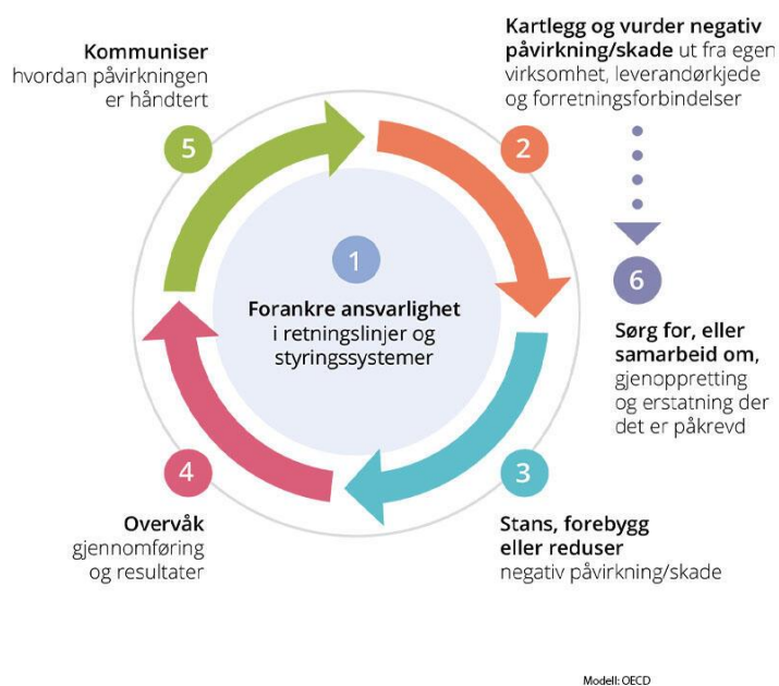
Figur 2: OECDs 6-stegsmodell for aktsomhetsvurderingsprosessen. (Figuren er hentet fra OECDs veileder for aktsomhetsvurderinger for ansvarlig næringsliv, 22.05.2023)

Foreliggende rapport er utarbeidet i samsvar med OECDs aktsomhetsmodell for vurdering av ansvarlig næringsliv (OECD, 2019). Rapporten er bygd på de seks ulike stegene som fremkommer av modellen ( Figur 2 ).