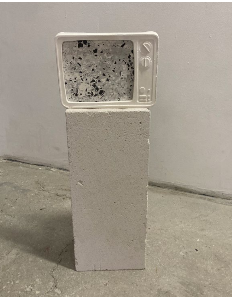
- Skulptur af Lucian Moriyama fra udstillingen "White Noise," Alkinois Art Space