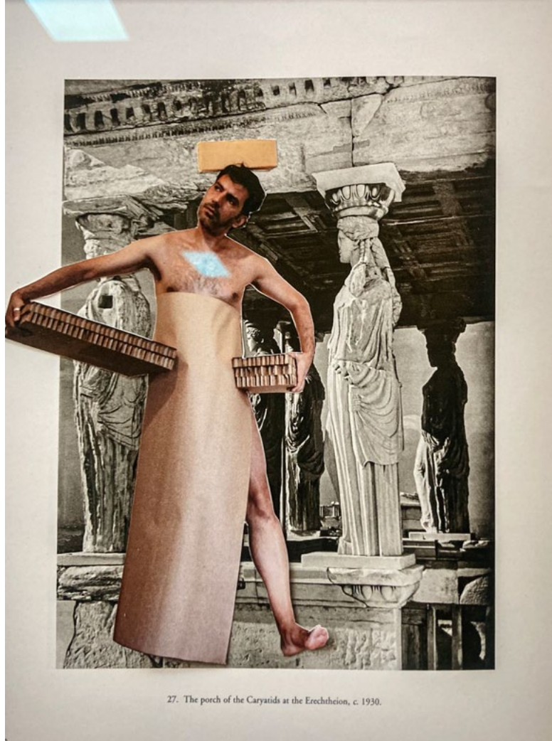
- Performance under udstillingen "Zeitgeist," Ammophila Contemporary art