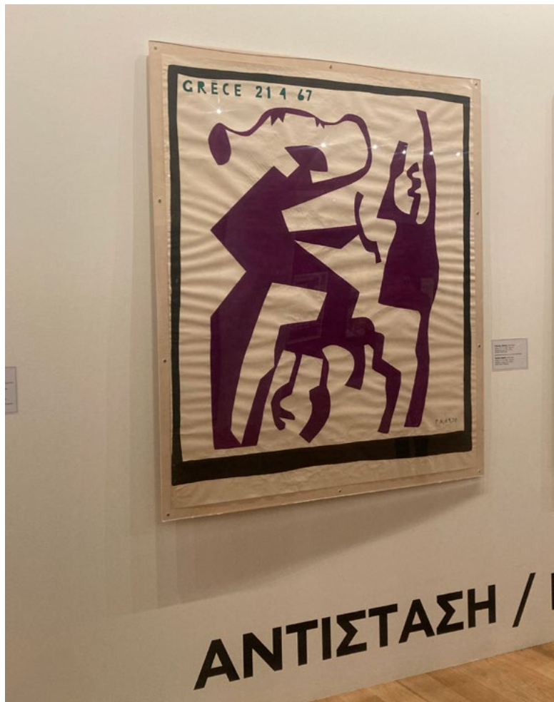
- Plakat i udstillingen Democracy på Nationalgalleriet