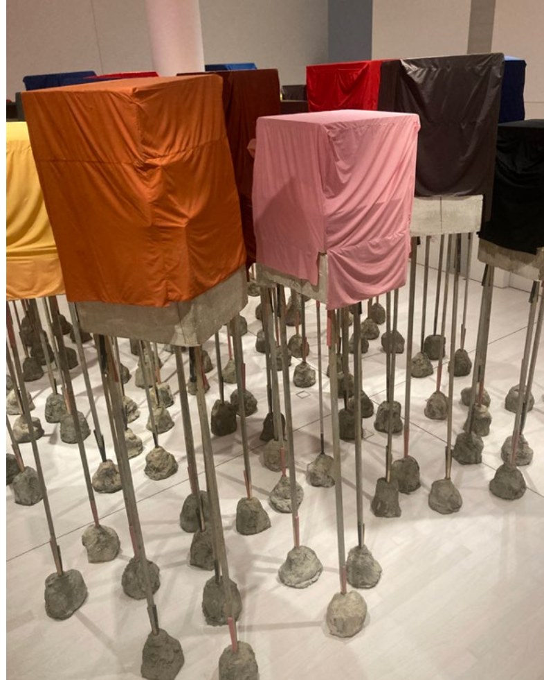
- Indeksering af typer af pasta fra udstillingen "A Dinner Study" på EIGHT/To OXTΩ