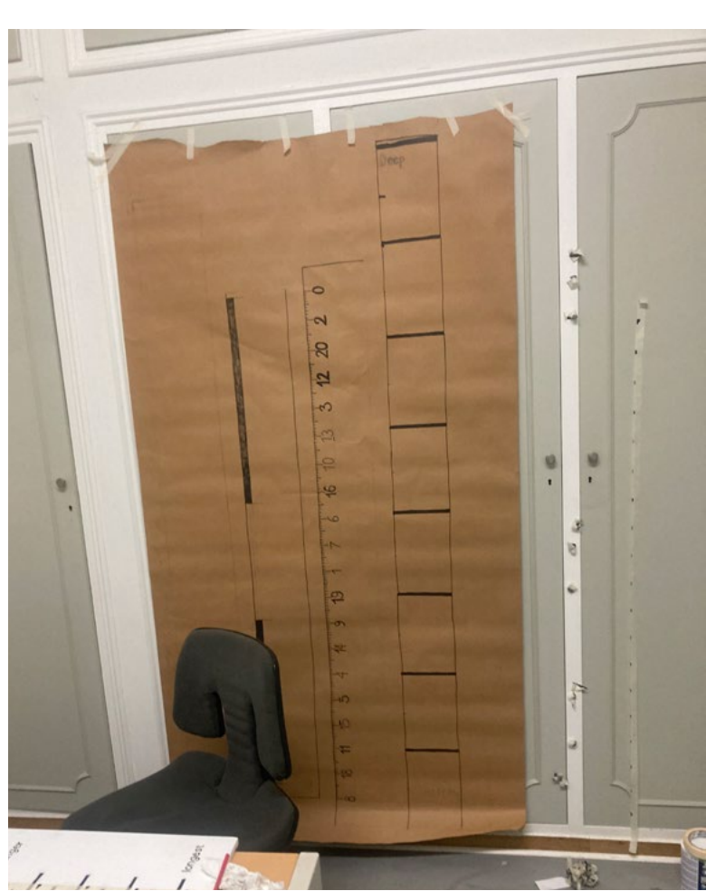
Fit to Measure