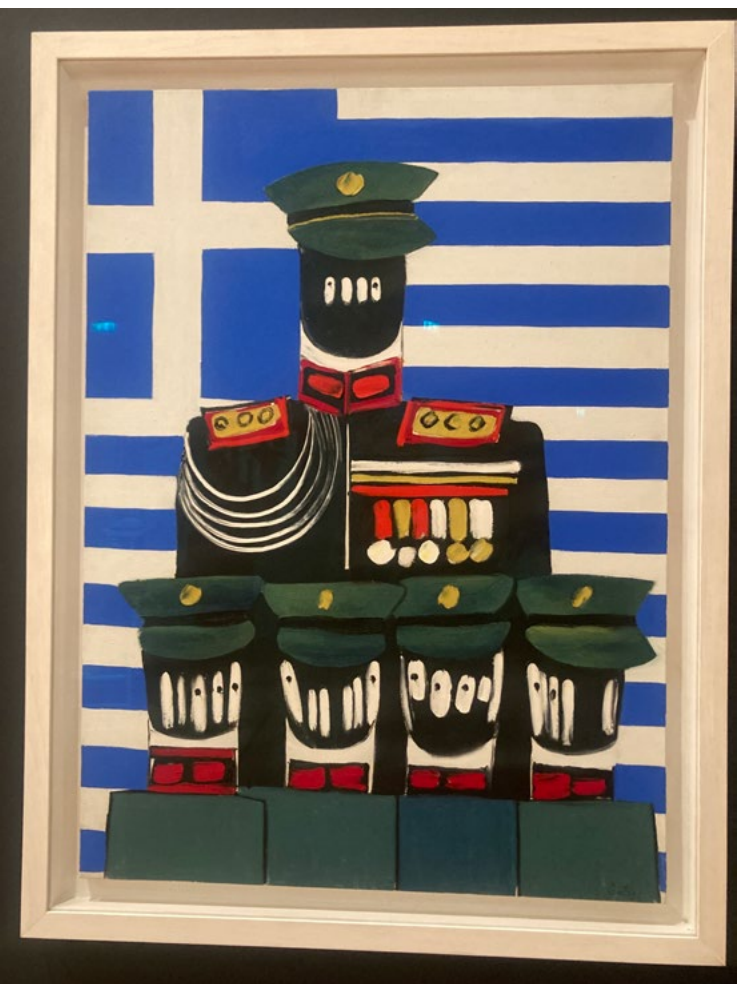
- Maleri af Yannis Gaitis i udstillingen Democracy på Nationalgalleriet