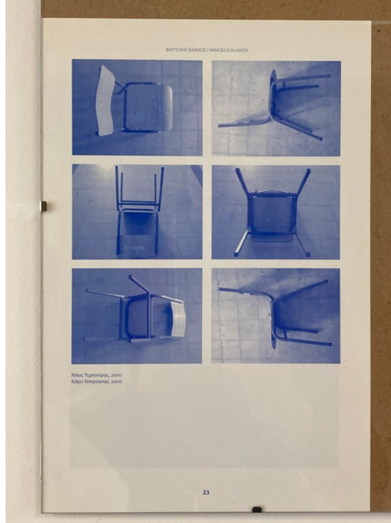
- Værk af kunstneren Vlangelis Vlahos "I wake from history, alive," Tavros