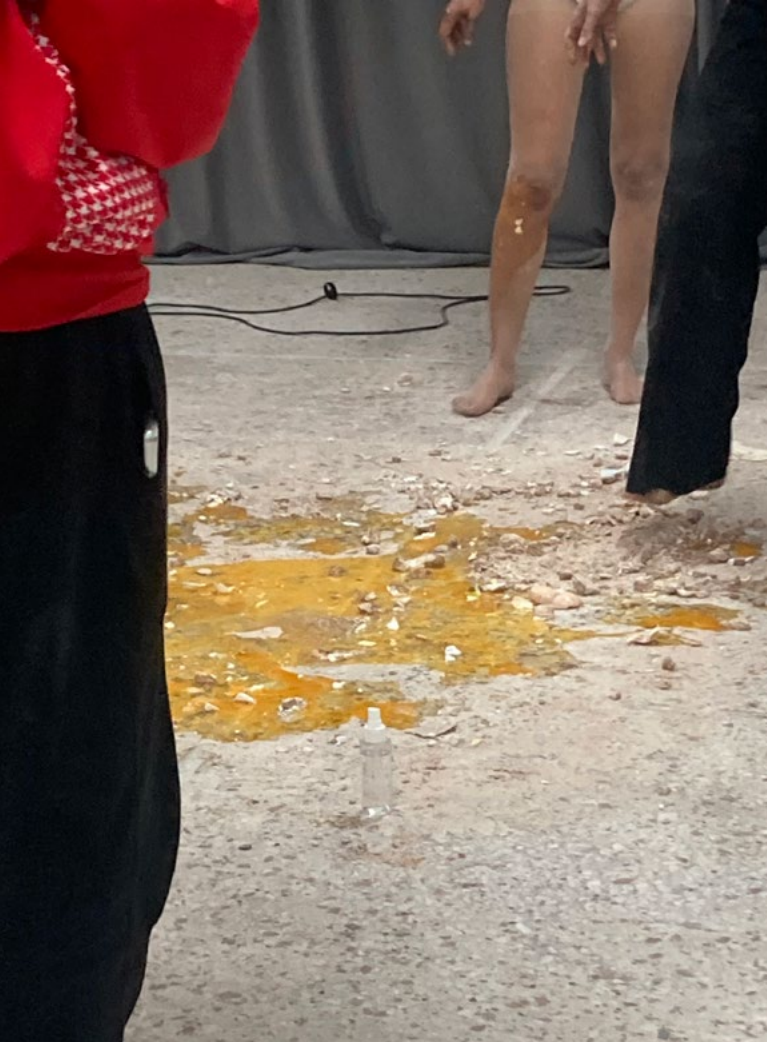
- Performance under udstillingen "Zeitgeist," Ammophila Contemporary art