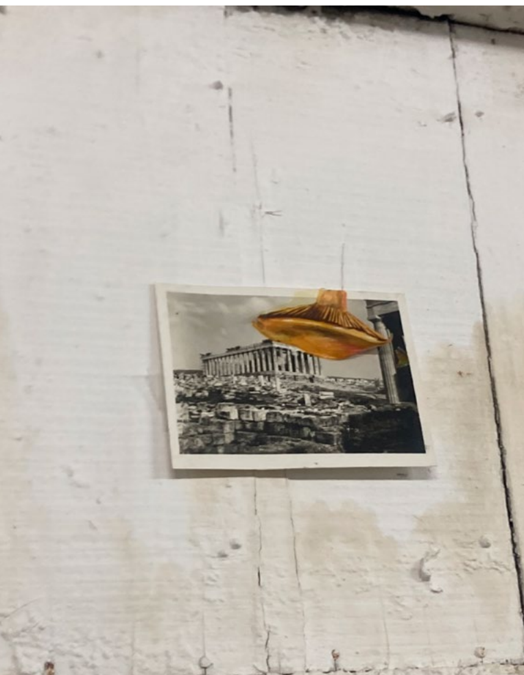
- Kollage med en kæmpe kanteral henover Akropolis fra udstillingen "A Dinner Study," på EIGHT/To OXTΩ