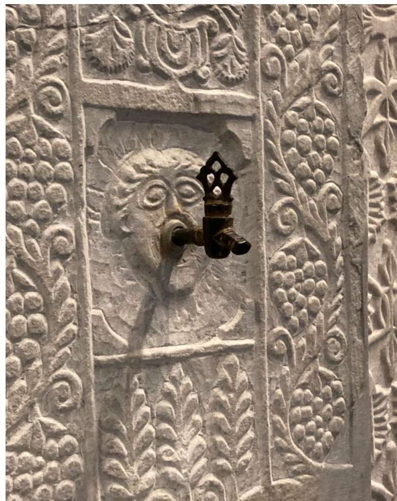
- Skulpturel vandhane på Benakimuseet