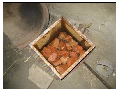
Morceaux de briques et clous dans un filtre de type Kanchan™

L'eau traitée devrait être récupérée par l'utilisateur dans un récipient de stockage sans danger, placé sur un bloc ou un pied, afin que l'ouverture du récipient soit juste en dessous de la sortie du filtre, minimisant ainsi le risque de re-contamination.