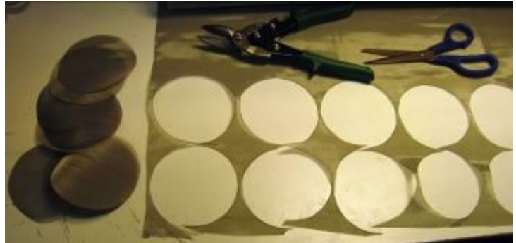
Recorte círculos de la malla