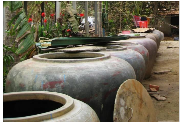
Oxidación pasiva en vasijas de agua