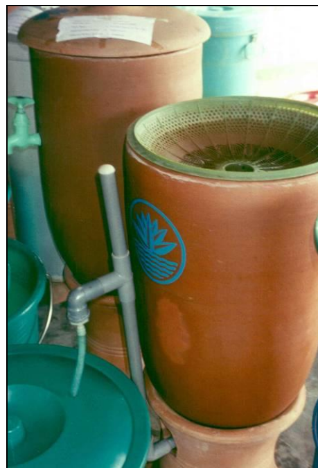
Filtro Shaplar

Los trocitos de ladrillos utilizados no son tóxicos y pueden ser eliminados de manera segura sin peligro para el medio ambiente o la salud humana, ya que el arsénico se adhiere fuertemente al hierro. El filtro de barro es reutilizable y de fácil mantenimiento.