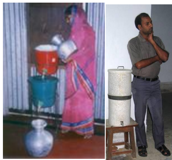
Filtro Magc-Alcan Filtro Nirmal

Existe un filtro similar llamado "filtro Nirmal" en la India. El arsénico es adsorbido por un medio de alúmina activada elaborado en la India. El agua se filtra a través de una vela de cerámica. El filtro tiene que regenerarse cada 6 meses.