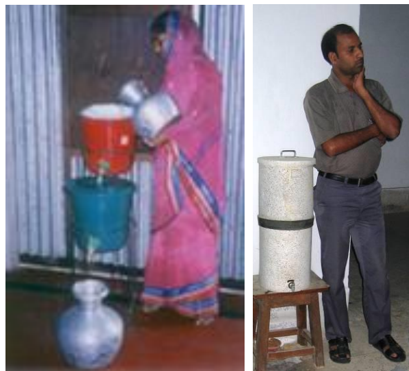
Filtre Magc-Alcan Filtre Nirmal

L'eau est ensuite filtrée à travers une bougie en céramique. Le filtre doit être régénéré tous les 6 mois.