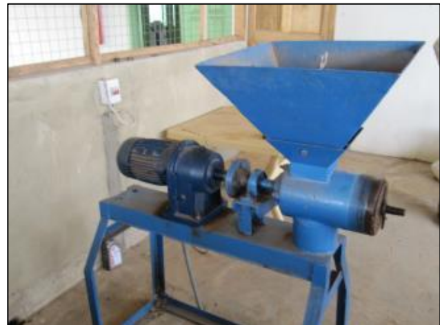
Machine à granulés en Ouganda et au Ghana