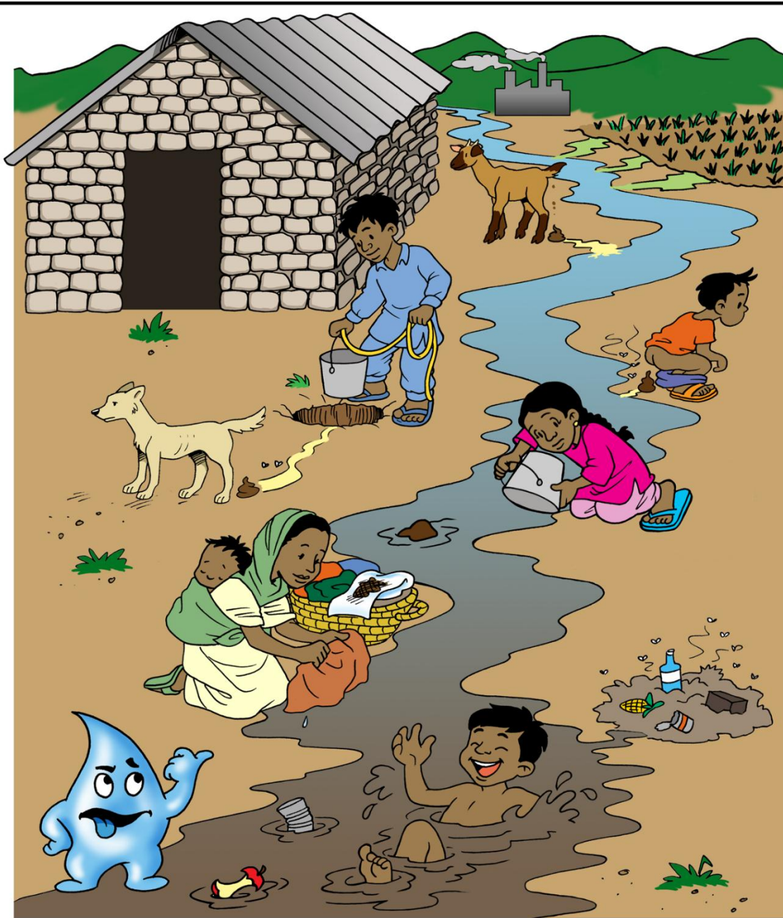
HOW WATER IS CONTAMINATED