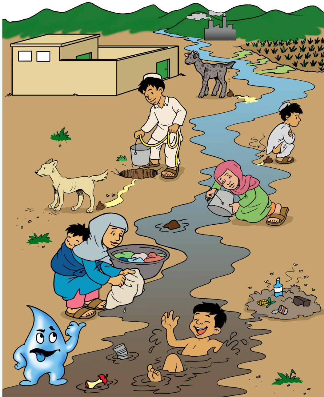
HOW WATER IS CONTAMINATED