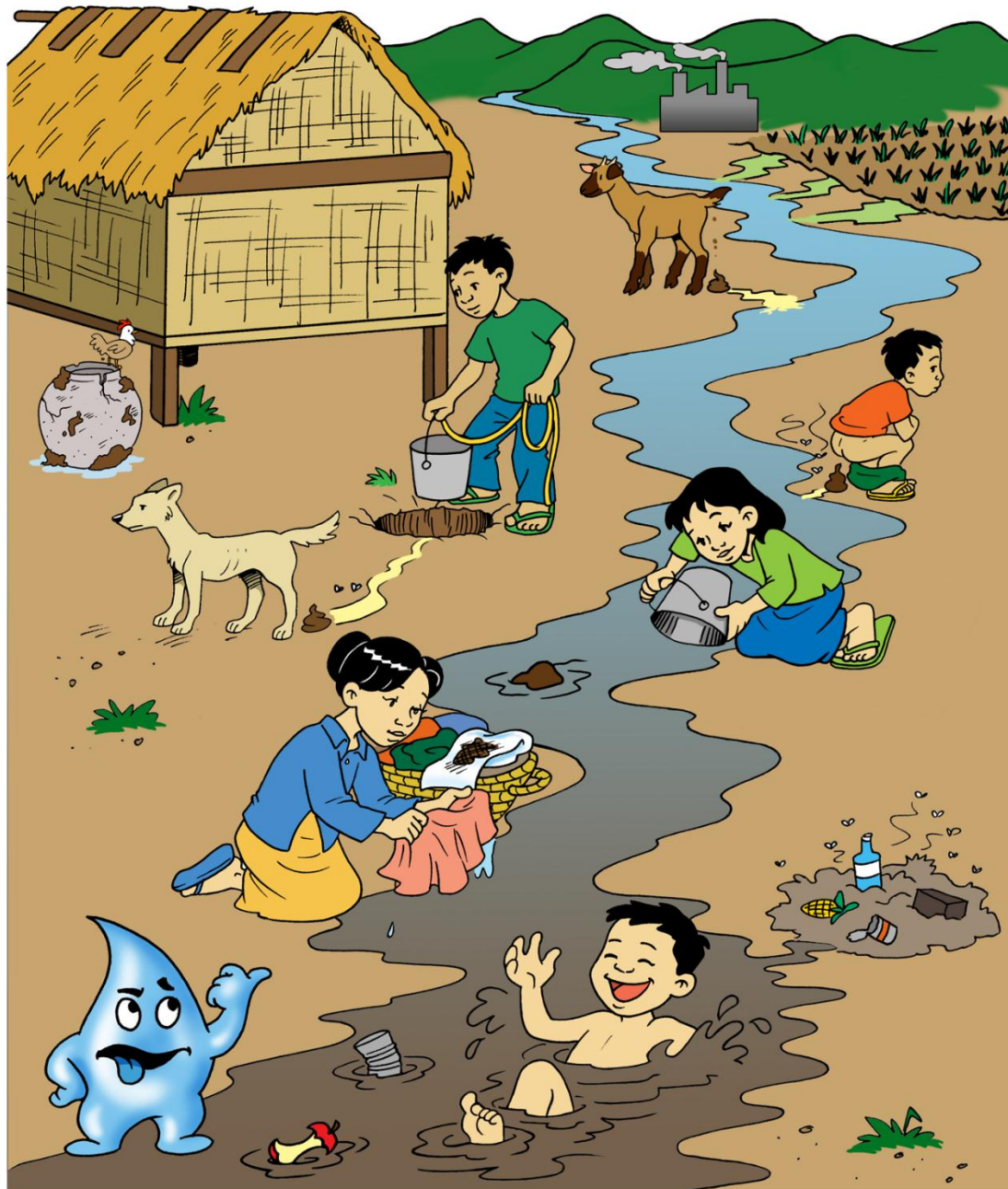
HOW WATER IS CONTAMINATED