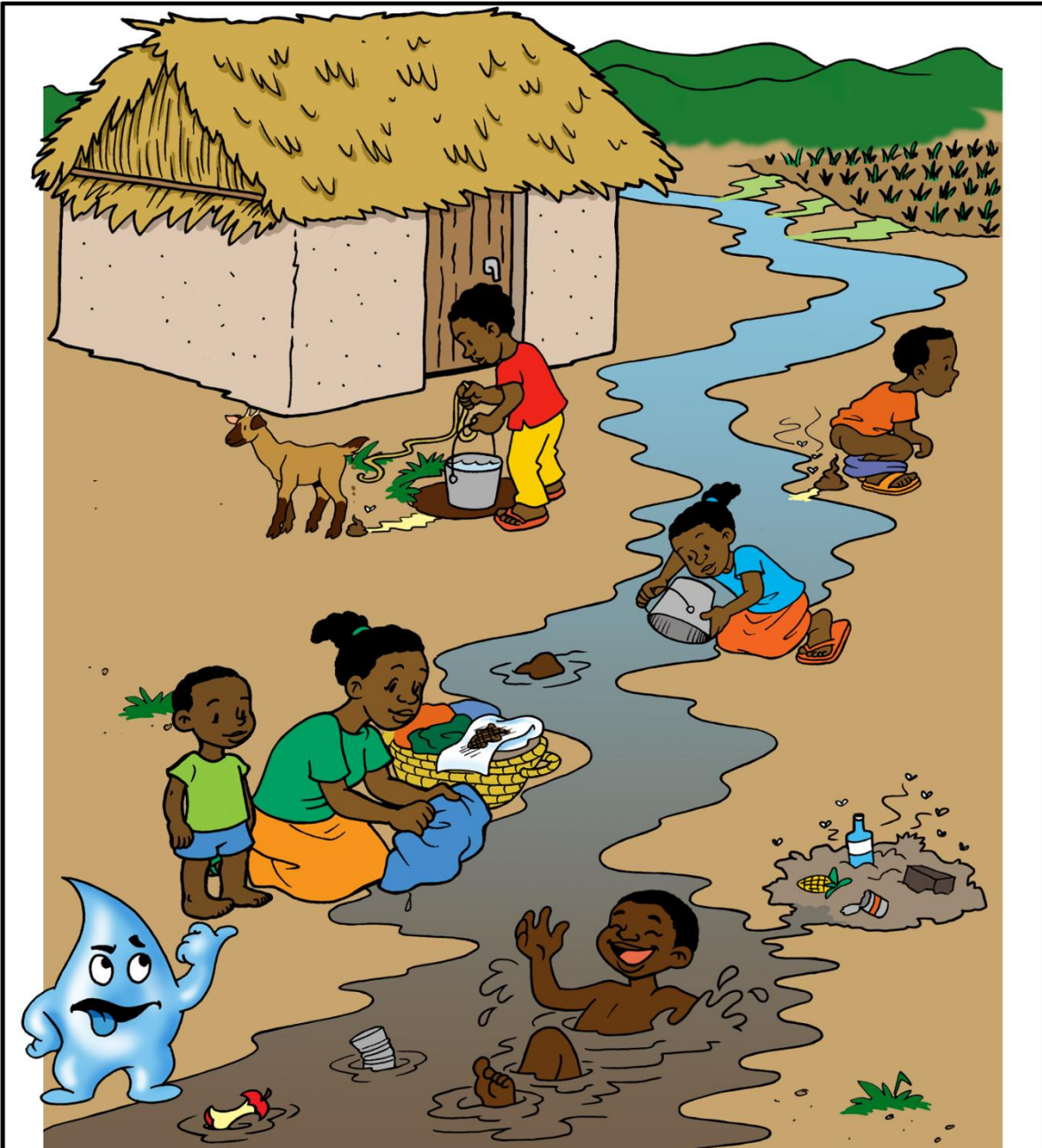
HOW WATER IS CONTAMINATED