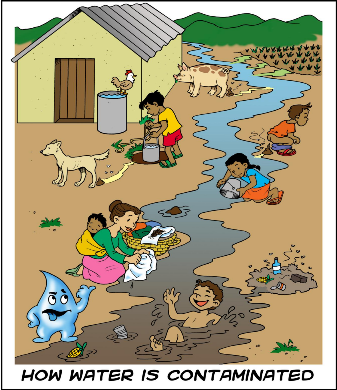
HOW WATER IS CONTAMINATED