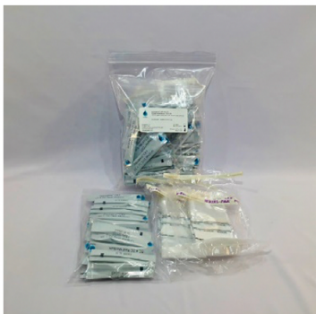
Kit CBT EC+TC MPN - 50 tests

https://www.aquagenx.com/product-documentation/