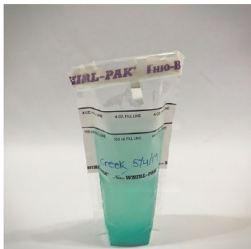
Positif pour E. coli