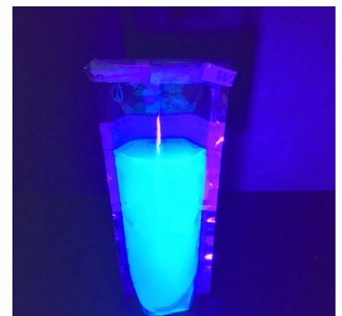
Positif pour coliformes totaux