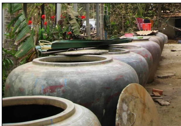
Oxydation passive dans les bocaux disponibles localement