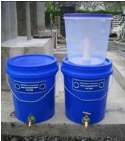
Filtres à charbon d'os, simple et combiné

Il devrait toujours avoir une couche d'eau qui couvre la surface du charbon d'os. Si le charbon d'os se dessèche, sa capacité d'absorption diminuera. L'eau devrait être en contact avec le charbon d'os pendant au moins 20 minutes avant de commencer le processus de filtration. On peut aussi combiner ce filtre avec un filtre à bougie en céramique pour éliminer ainsi la contamination microbiologique (voir la photo). On ne devrait pas utiliser l'eau des premiers quelques contenants collectés si on utilise un filtre pour la première fois, ou après avoir rempli le filtre avec de nouveaux granules de charbon d'os, car l'eau aura une couleur défavorable et un niveau de turbidité élevé (CDN, 2006).