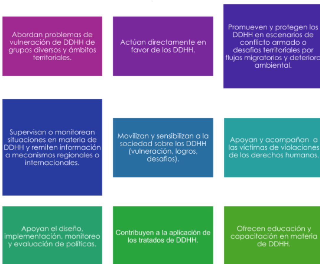
Tabla 7. Acciones de las personas defensoras de DDHH

Por las condiciones del contexto, las defensoras apoyan a las comunidades afectadas y promueven alertas tempranas para prevenir acciones que puedan incrementar las violaciones a los DDHH mediante las siguientes actividades.