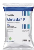
Sacco: 8 kg Pallet: 640 kg