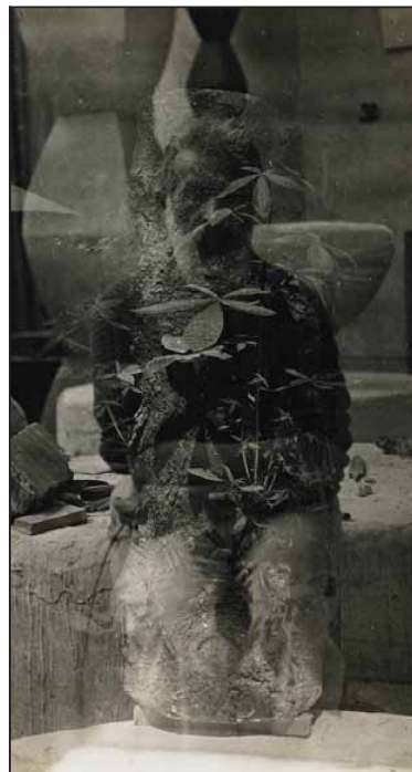
AUTO PORTRAIT DANS L'ATELIER ET TRONC D'ARBRE, PARIS (1933): Brancusi fremstiller seg her som en slags naturkraft – like mye natur som kunst. (Privat samling.)