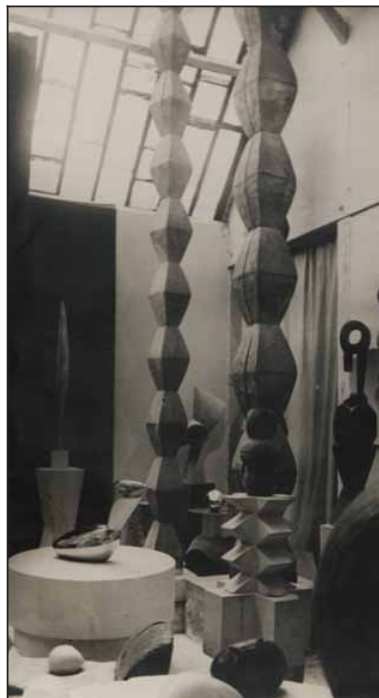
VUE DE L'ATELIER (1927): Brancusis atelier blir et mytisk opprinnelsessted hvor skulpturene inngår i komplekse montasjer.

I den modernistiske skulptøren Constantin Brancusis kunstneriske tenkning var fotografiene en fortsettelse av atelieret, skulpturenes egentlige hjem.