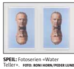
SPEIL: Fotoserien «Water Teller». FOTO: RONI HORN/PEDER LUND

Horn beskriver tegning som en nøkkelaktivitet, og de fire pigmenttegnningene som nå vises på Vigeland-museet,