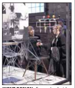
KJENT DESIGN: Eames' arbeider på Doga i Oslo.

KUNST «Eames by Vitra» Norsk design- og arkitektursenter (Doga), Oslo Til 1. mars En gang var ekteparet Eames nå så utbredte design eksperimentell. ANMELDELSE «Take your pleasure serious-ly» er et ofte sitert utsagn fra Charles Eames, som sammen med kona Ray regnes som et kraftsentrum i moderne design. Med bakgrunn fra henholdsvis arkitektur og bildekunst sto de for en unik, lekende energi. Deres arkitektoniske ideer, møbler og bruksgjenstander kom med en banebrytende formtenkning vi i dag kanskje har sett oss blinde på, hvor for eksempel Eames' «Plastic Side Chair» er blant de mest solgte stolene i Norge. Eames' kombinasjon