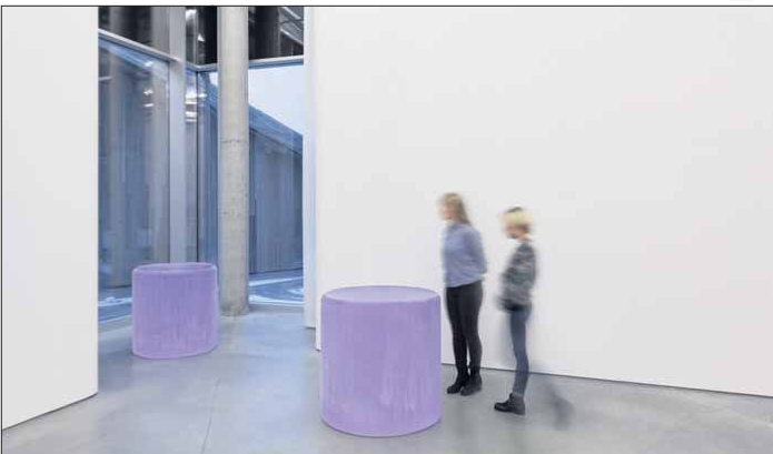
VANN: I tillegg til fotografier stilles to vannskulpturer av Roni Horn ut på galleriet Peder Lund i Oslo: «Untitled (The sensation of longing for an eclipse of the moon)» og «Untitled (The sensation of being scrutinized by a reptile)».

I tillegg er doblingen iøynefallende hos Horn som en estetisk og konseptuell strategi. Skulpturer og fotografier opptrer ofte i par, kjent er den doble avbildningen av en uttoppet islandsk snøugle. Et dialogisk element oppstår en slags energioverføring mellom to aktører og