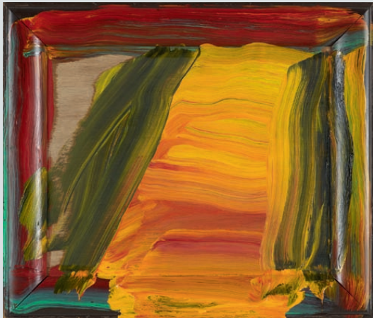
Howard Hodgkin: «Arabian Sea» (2008–2010).