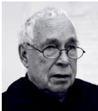
SIR HOWARD HODGKIN (CBE, CH)

For noen år siden hadde jeg en utstilling på Metropolitan Museum i New York. En ung, kjekk mann kom bort til meg og sa: «Vær så snill, du må slutte å drive min kone til vanvidd. Bildene dine er så emosjonelle at hun blir helt opprørt av dem.» Det synes jeg var veldig hyggelig