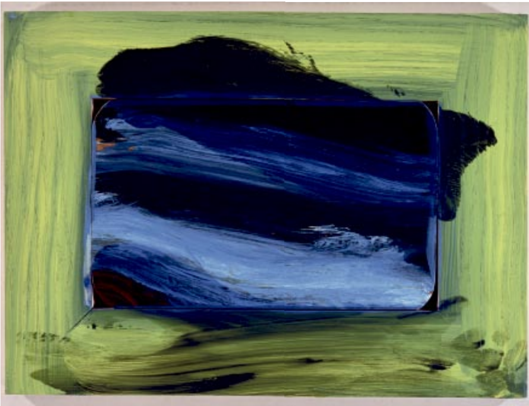
FISHERMAN'S COVE, 1993. © HOWARD HODGKIN.

▼ «FISHERMAN'S COVE». Sir Howard mener det sies mye tåpelig og svulstig om farger, og misliker sterkt å bli kalt kolorist. Maleriet «Fisherman's Cove» ble likevel en fargesnakkis, særlig på grunn av rammen.