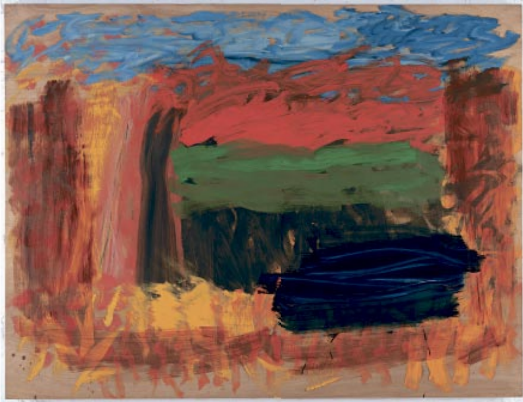
HOME, HOME ON THE RANGE, 2008. © HOWARD HODGKIN.

▲ «HOME, HOME ON THE RANGE». Fra 1940 til 1943 bodde familien Hodgkin på Long Island, New York. Howard Hodgkin mener at de tidlige opplevelsene av amerikansk samtidskunst formet ham. I 2008 stilte han ut en serie verker kalt «Home, Home on the Range».