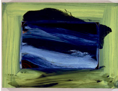
Foto: M&P, © Howard Hodgkin, Kunstforeningen, Galleri Sankta Sofian, Stockholm, 2010.