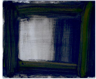
© Howard Hodgkin, Kunstforeningen, Galleri Sankta Sofian, Stockholm, 2010.

▼ FISHERMAN'S COVE Sir Howard mener at sine merkelige og svulstige omfang og miksler sterke blå kalt Fisherman's Cove ble tilknyttet en bergensskis, særlig på grunn av sammen.