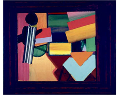
© Howard Hodgkin, Kunstforeningen, Galleri Sankta Sofian, Stockholm, 2010.