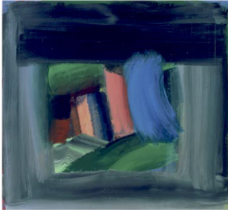
© Howard Hodgkin, Kunstforeningen, Galleri Sankta Sofian, Stockholm, 2010. © Howard Hodgkin, Kunstforeningen, Galleri Sankta Sofian, Stockholm, 2010.