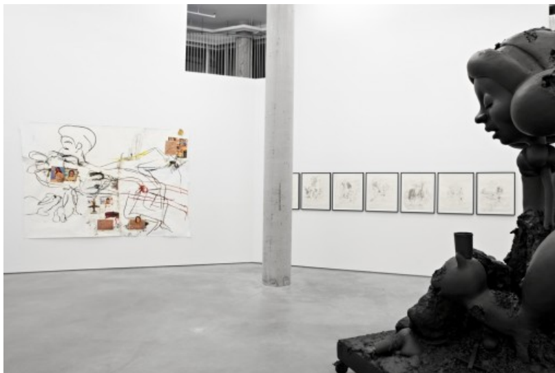
Paul McCarthy, White Snow på Peder Lund.

Peder Lund, Oslo 8. september - 2. oktober 2012