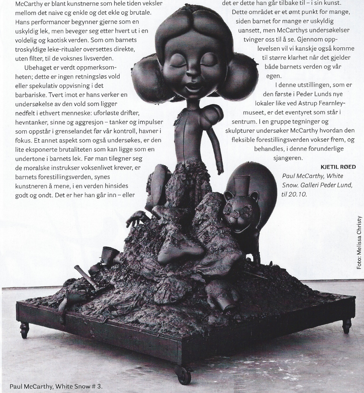
Paul McCarthy, White Snow # 3.

Paul McCarthy, White Snow. Galleri Peder Lund, til 20.10.