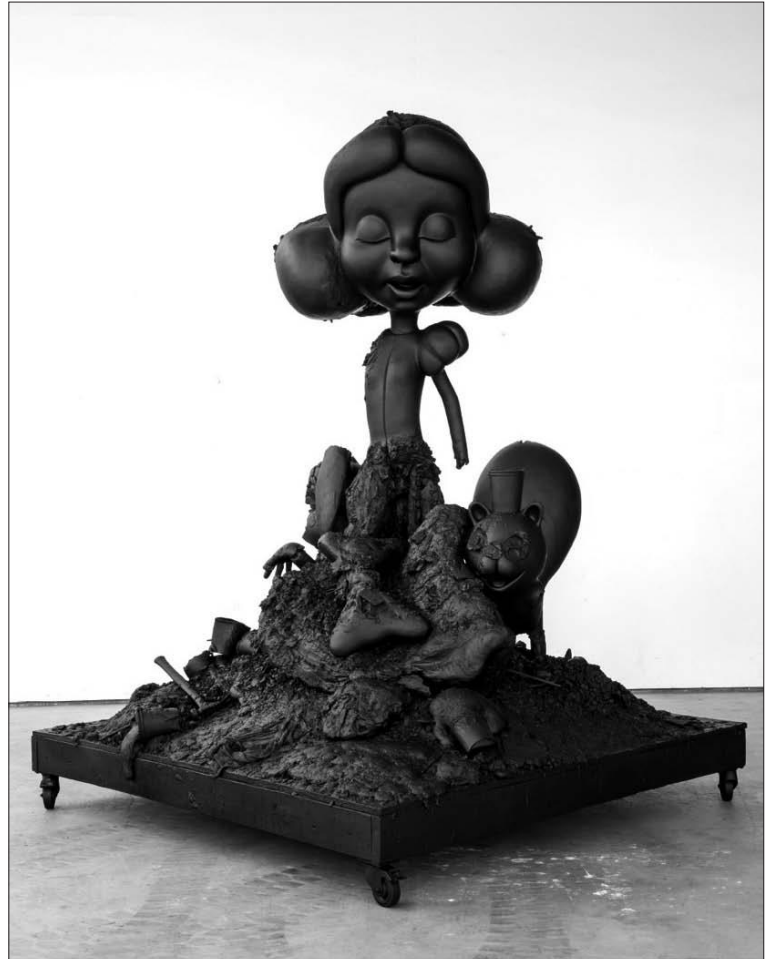
Paul McCarthy er provokatøren som elsker eventyrfigurer. Her ser vi «White Snow #3» (2012), bronse, av Paul McCarthy.

Ekspresjonisme er mer tydelig hos McCarthy enn pop art, selv om figurene hans stammer fra populærkulturen. Referansene leker ikke, han kjemper med dem. Når de kopulerende eventyrfigurene viser fingeren til et puritansk USA handler det om