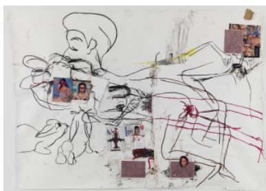
Paul McCarthy, 100 , 2009.

Det er med andre ord snakk om den samme metoden som har preget mye av McCarthy's oeuvre. En metode der såpeopera-, tegneserie- og