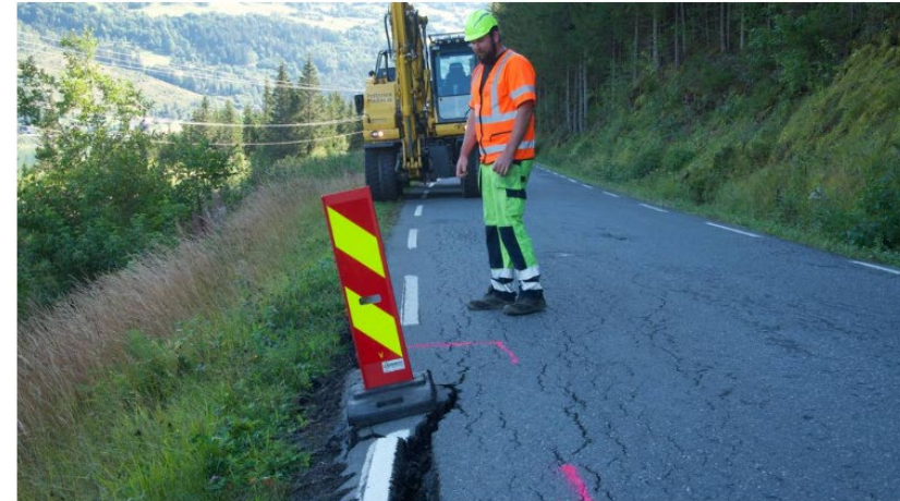
ASFALTEN RASER: Ytre del av omkjøringsvegen har nå løsna på vegen som går inn til Tretten.

Digre lastebiler må ut på kanten når de møtes på den smale omkjøringsvegen til Tretten i Gudbrandsdalen. Nå går asfaltkantene i oppløsning.