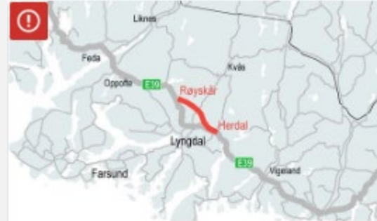
E39 Herdal – Røyskår