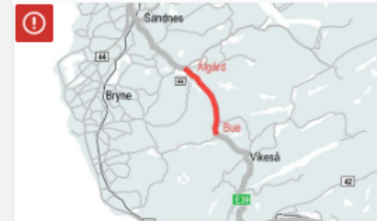
E39 Bue – Ålgård