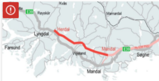
E39 Mandal – Herdal